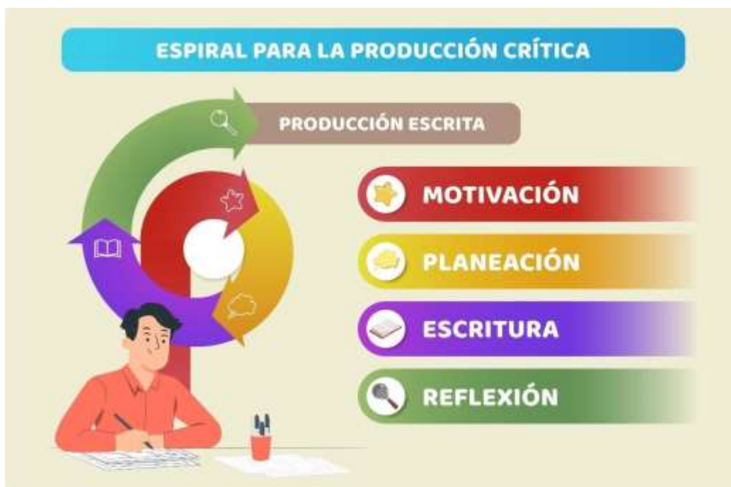
ILUSTRACIÓN 2ESPIRAL PARA LA PRODUCCIÓN CRÍTICA (EPC)

Dando continuidad a los procesos y teniendo en claro los resultados de la prueba diagnóstica, se procedió a la etapa de diseño la propuesta pedagógica-didáctica que se precisó entre los objetivos del proyecto. Atendiendo a las necesidades halladas, esta propuesta cimentó su enfoque al eje referido a la PRODUCCIÓN TEXTUAL como forma de expresión del pensamiento crítico en el aula virtual. Por tanto, fue pertinente resaltar este componente a través de todos los demás ejes, ya que estos convergen uno a uno desde la ética de la comunicación, la comprensión, la literatura, los sistemas simbólicos y la comunicación como medios y técnicas de reforzamiento a la capacidad crítica y argumentativa en los estudiantes. En ese orden de ideas, el proyecto propone ejecutar la propuesta pedagógica Espiral para la Producción Crítica (EPC) para favorecer los procesos de expresión discursivas para generar pensamiento crítico desde la mediación educativa virtual. A Continuación, un esquema que evidencia los momentos de la espiral: