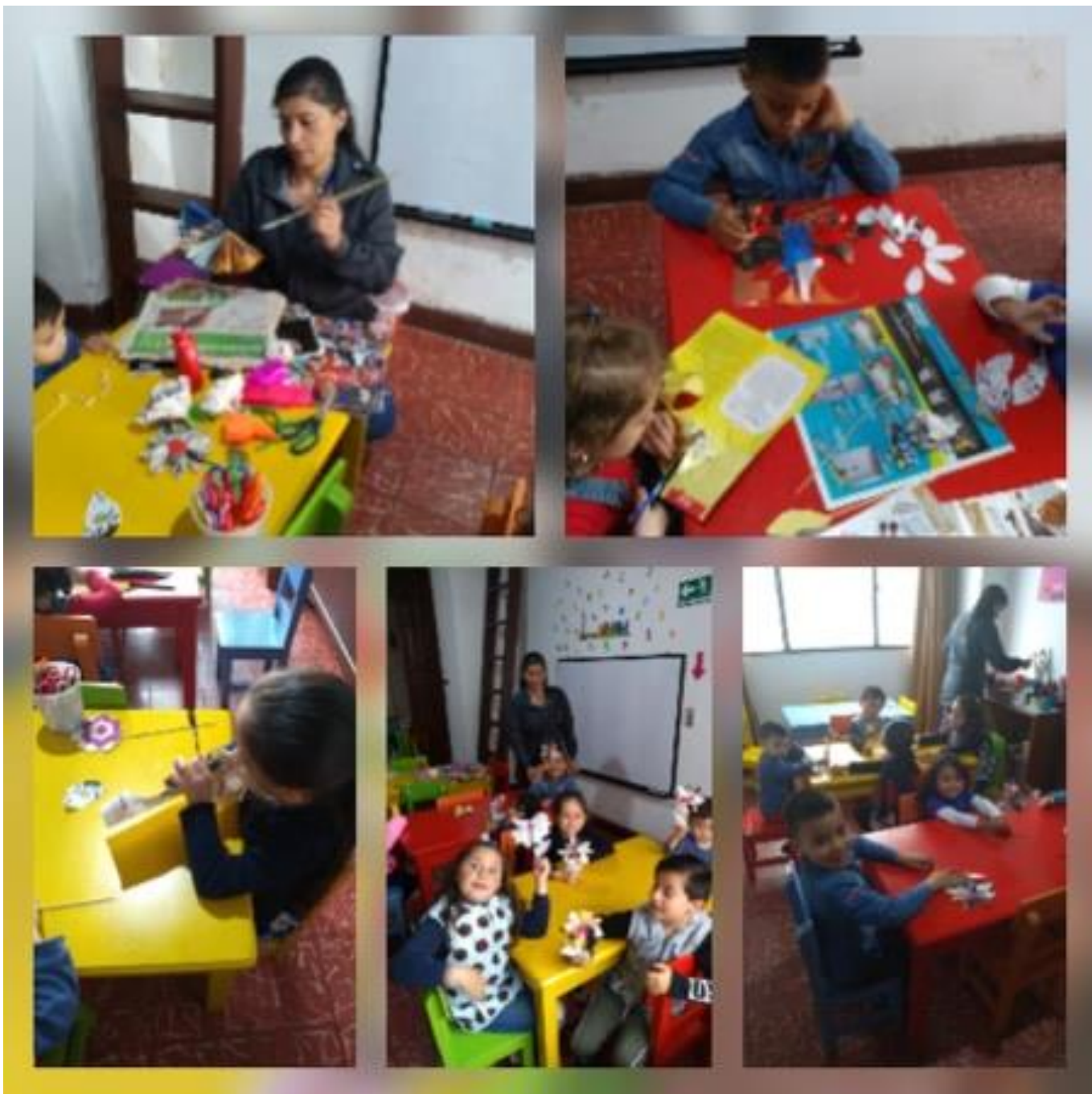
Imagen 4: flor de hoja de revista