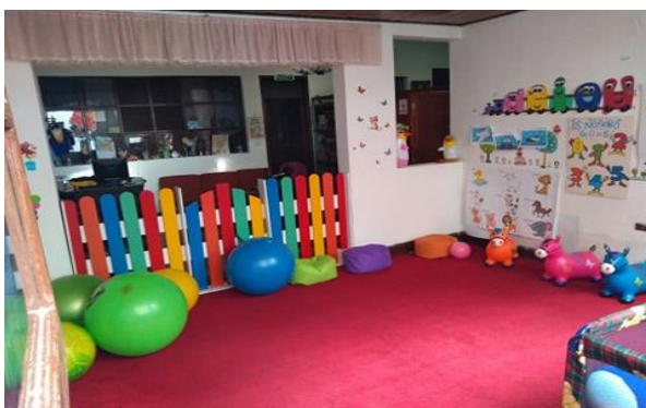
figura 5: Salón de gateadores y párvulos