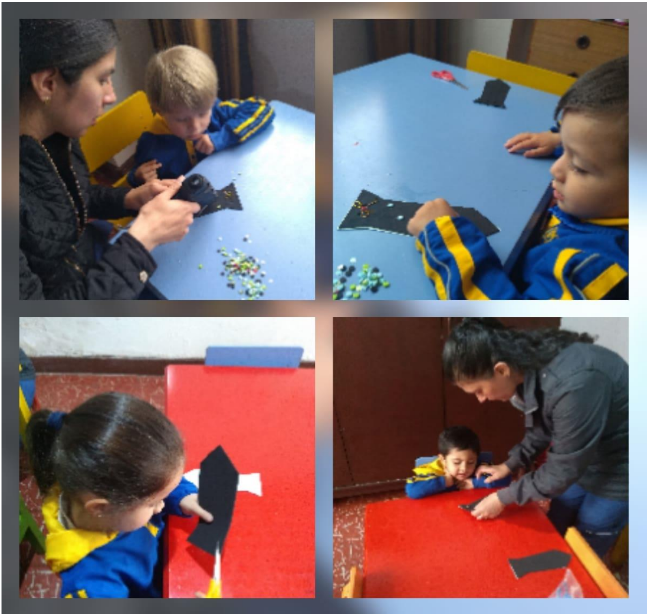
Imagen 2: Elaboracion de tarjeta en foamy