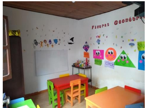
figura 4: Salón de transición