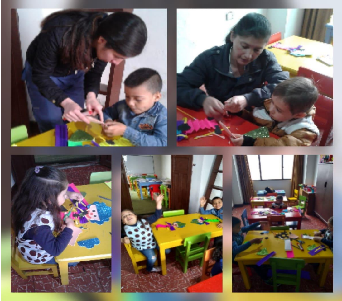
Imagen 5: creando un payaso en foamy