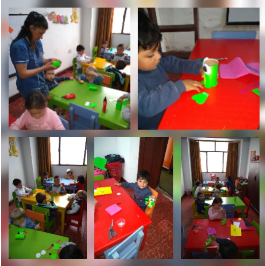
Imagen 7: creando una rana en tubos de papel higiénico