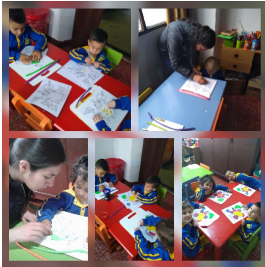
Imagen 6:Decorando con plastilina un payaso