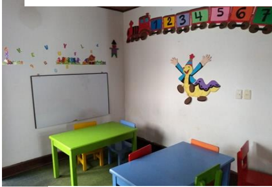
Figura 1: Salón de Jardín