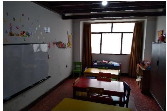
figura 2: Salón de Prejardín