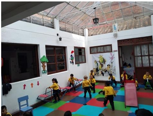
Figura 3: Patio de recreación