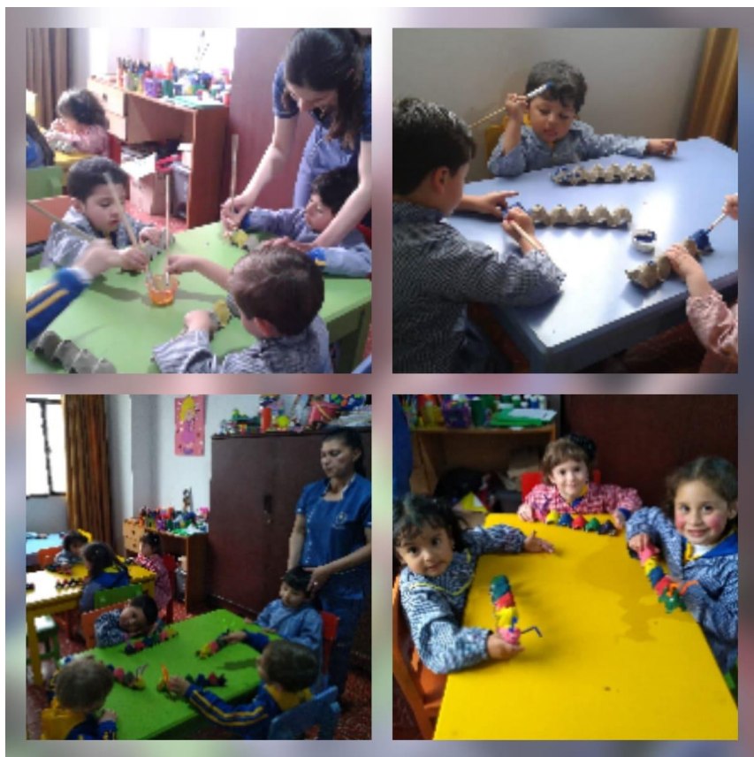
Imagen 3: Manualidad el gusano