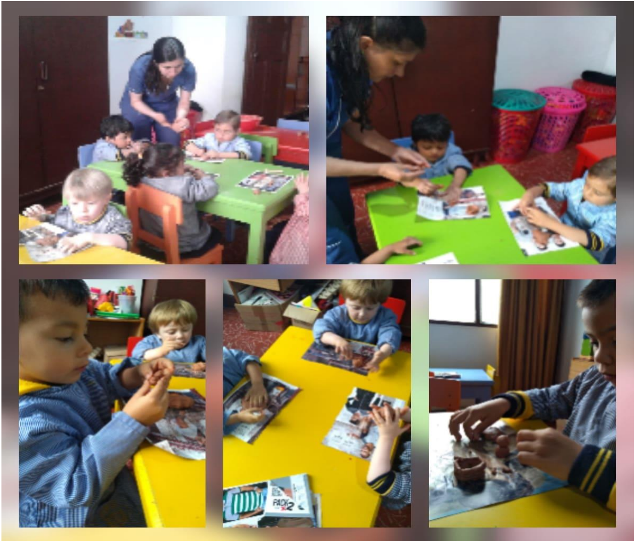
Imagen 1: jugando y explorando con arcilla