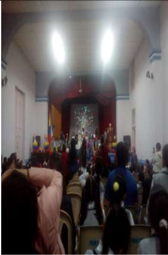
ANEXO C IZADAS DE BANDERA