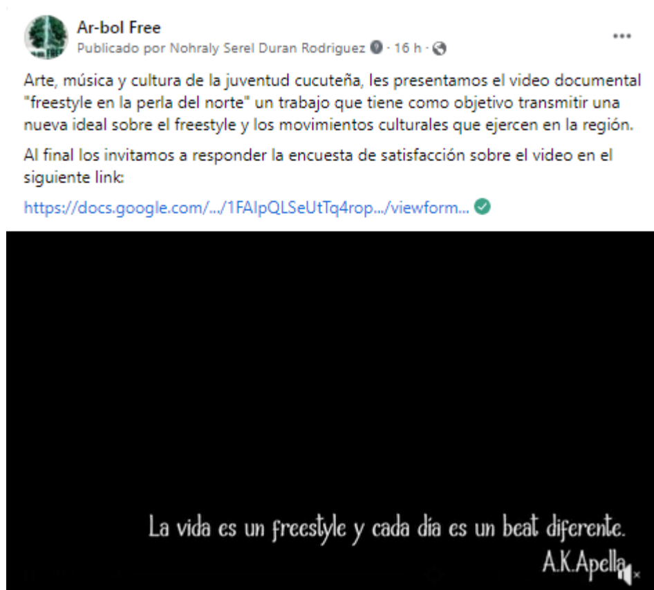
Imagen captura evidencia de publicación en página de Facebook oficial AR-BOL FREE