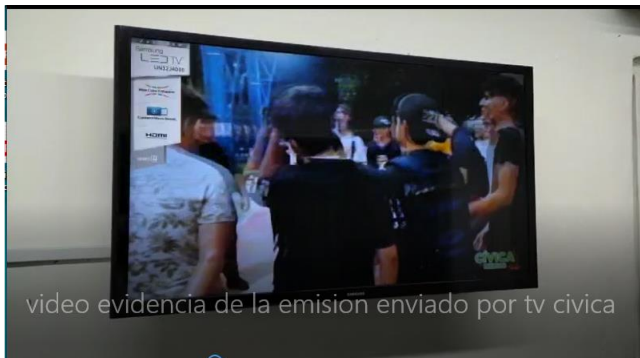
Imagen captura evidencia de emisión en TV CÍVICA