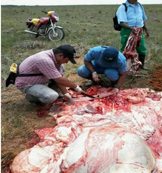
Figura 4. Necropsia en bovino.

poder establecer la causa de su muerte; en este caso un bovino con posible síntomas de carbón bacteriano.