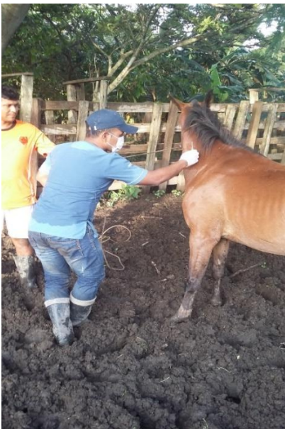
Anexo 3. Implementación de la vacuna contra la EEV. Fuente: Barragán, (2016).