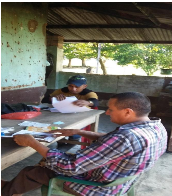
Anexo 2. Visitas técnicas a las diferentes fincas del departamento.