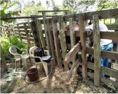
Figura 2. Chequeo ecográfico, del estado reproductivo de las hembras (bovino).

Según se ilustra en la Figura 2, se realiza un chequeo ecográfico debido a que es fundamental para el diagnóstico del ciclo reproductivo de las hembras, una vez se comprueba el ciclo estral se determina si el animal puede entrar en el plan de mejoramiento genético por medio de inseminación artificial a término fijo o no.