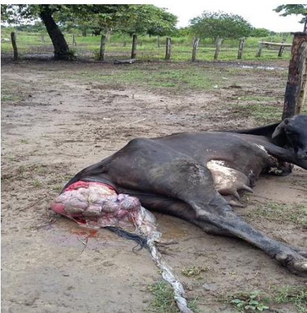
Figura 3. Prolapso uterino, generado un parto distócico.

La Figura 3, ilustra un prolapso uterino, esta patología por lo general se da de forma secundaria a partos distócicos, falta de contracciones uterinas en el parto, terneros muy grandes o cavidad pélvica reducida.