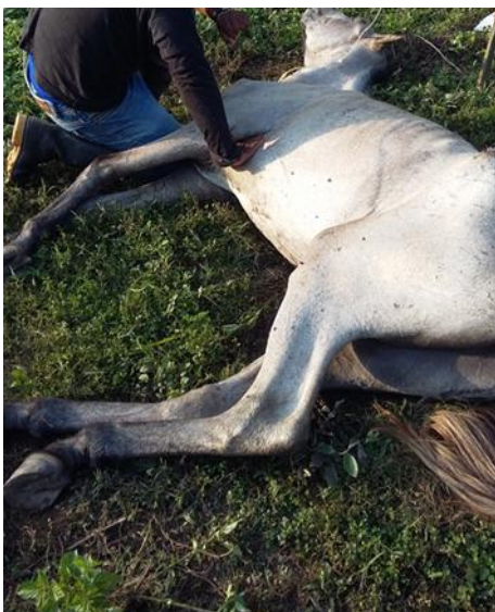
Anexo 1. Equino de 3 años de edad con sintomatología nerviosa.