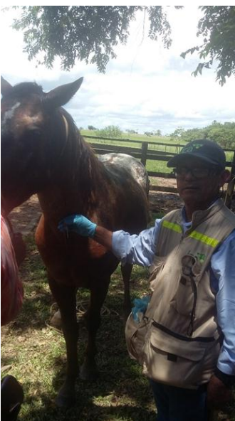
Anexo 4. Toma de muestra sanguínea para confirmación del caso.