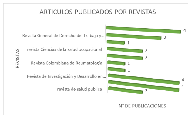
Fig. 3. Publicaciones por revistas

Para realizar un estudio y análisis completo de los artículos encontrados, se elaboró una tabla en la cual se tomaron en cuenta los datos más relevantes de cada uno, como título, año, autor(es), revista de publicación, metodología y aportes ( Ver anexo Tabla 1 ).