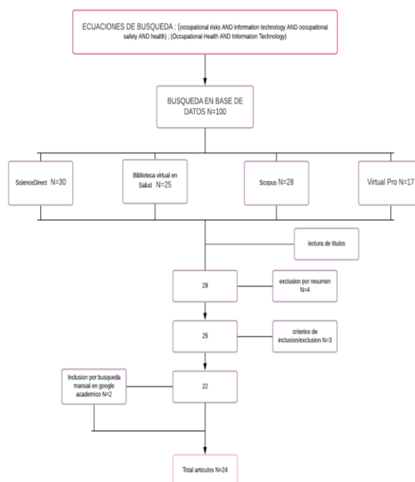
Fig 1. Diagrama de flujo proceso de selección de los artículos

Se realizó una búsqueda en las diferentes bases de datos encontrando 100 resultados, de los cuales solo se seleccionaron 29 después de una eliminación por títulos; posteriormente se aplicó el proceso de exclusión de aquellos artículos que no contaban con un resumen inicial, dando como resultado la eliminación de 4 referencias. Más adelante se aplicaron los criterios de inclusión en los cuales se analizaron solamente aquellos artículos centrados en los riesgos laborales asociados al uso inadecuado de las TIC, además de estar dentro de la fecha delimitada para su estudio 2017 a 2021, por lo cual se da la eliminación de 3 artículos, para un total de 22 referencias bibliográficas. Por último, se realiza una búsqueda manual por google académico, encontrando 2 artículos que cumplen con los criterios establecidos; considerando por tanto 24 artículos relevantes para su análisis y estudio final. (Fig1).