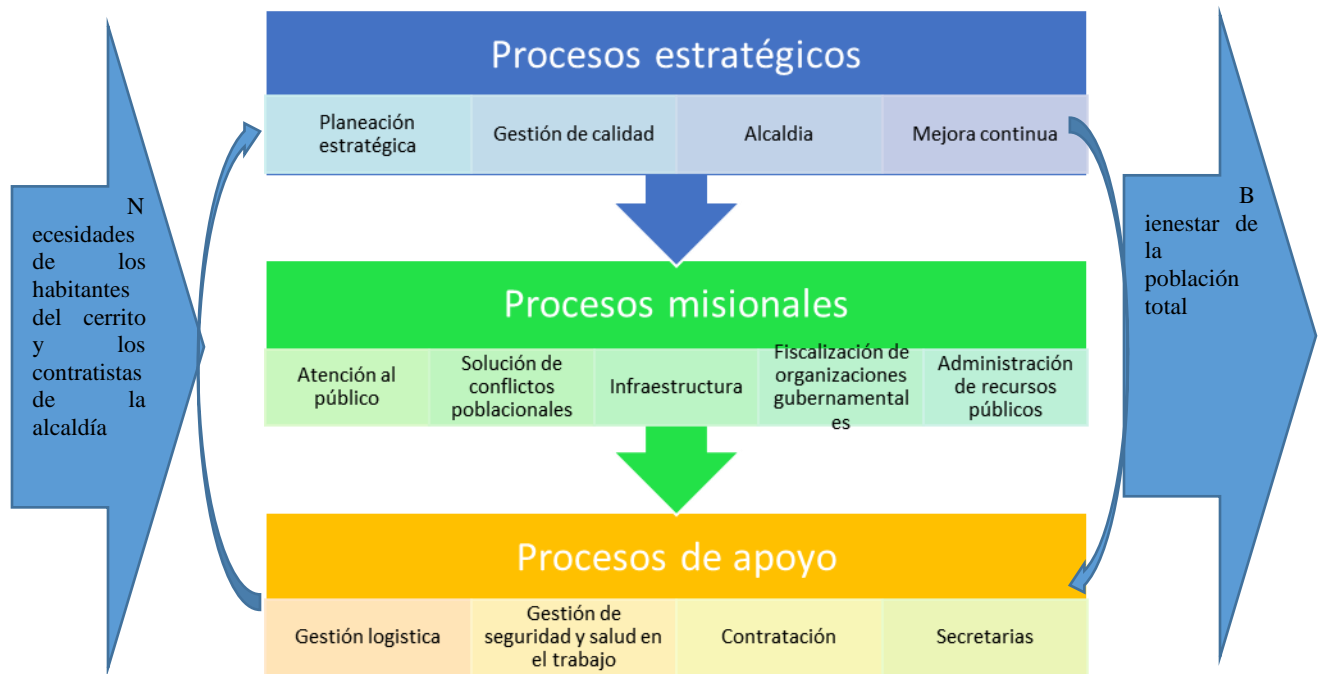
Figura 2 Mapa de procesos de la Alcaldía El Cerrito, Santander