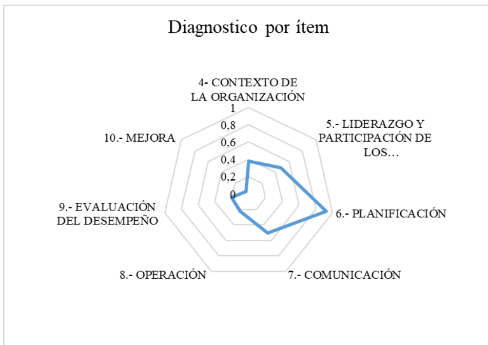
Figura 1 Diagnóstico inicial

Los resultados obtenidos del proceso de diagnóstico que se encuentra consignado en los anexos (Véase Anexo 1) se logra evidenciar las siguientes condiciones, ello acorde con la NTC ISO 45001. De los resultados se logra concluir la siguiente situación la que será analizada a profundidad en los apartados siguientes: