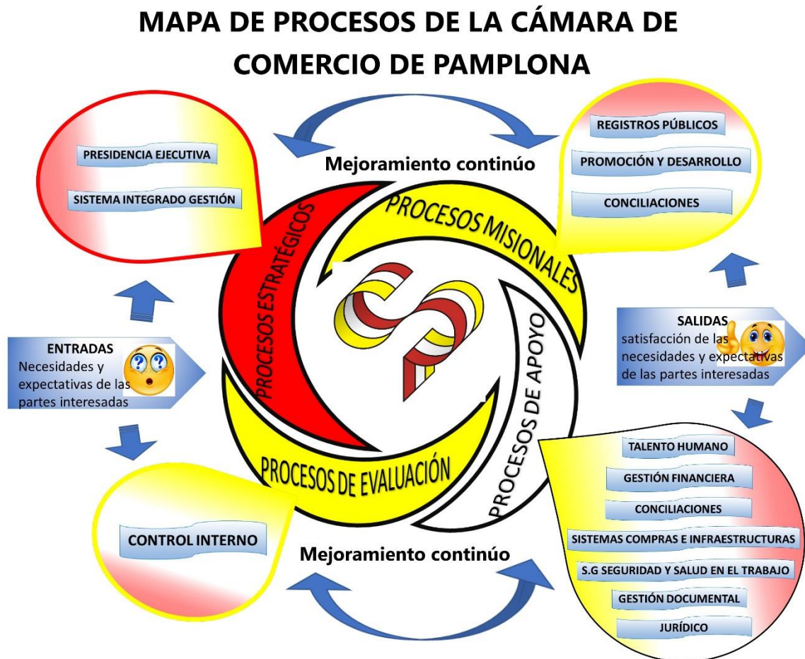
Ilustración 3: Mapa de procesos actualizado de la cámara de comercio de pamplona.