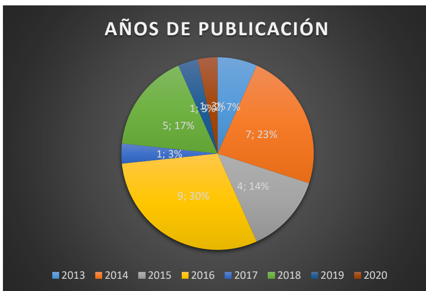
Grafico 1. Representación estadística de la cantidad de artículos por año.

Se evidencia en la Tabla 1. El 66,5% de los documentos provienen de bases de datos de bibliotecas electrónicas, y el 33,5% restantes es de revistas de distintas universidades.