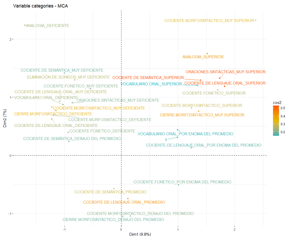
Tabla 13. Acompañamiento de las variables

agrupamiento entre ellas misma, en cuanto a la variable del grado presenta mayor agrupamiento con eliminación de sonido y lenguaje oral, en cambio las variables dependientes de analogías, oraciones sintácticas, cierre morfosintáctico, cociente fonético se agrupan entre ellas.