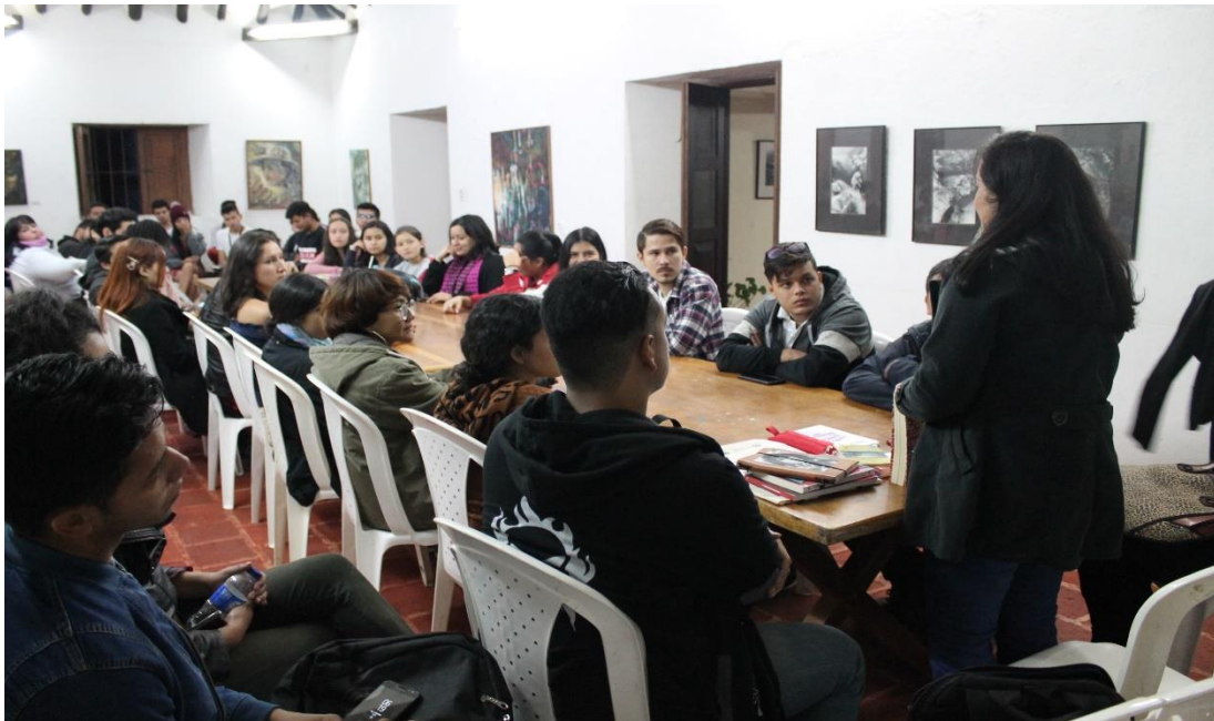
Apéndice 7 Taller sobre detonadores y verosimilitud