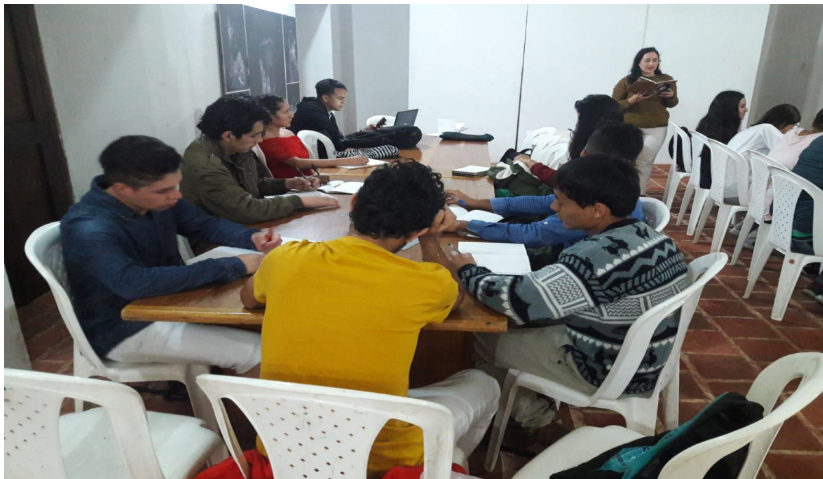
Apéndice 10 Taller de escritura – disparadores de la escritura