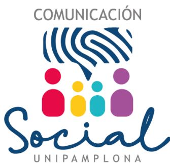
Figura 2 Logo de Comunicación Social