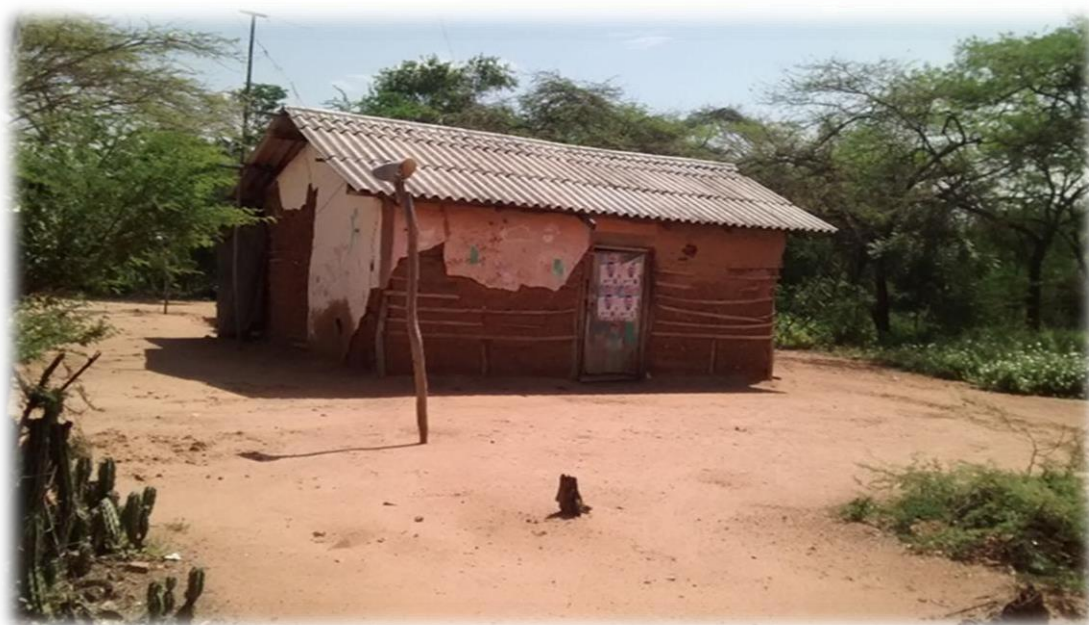
Figura N° 5. Foto tomada el 17 de octubre del 2015

La casa es construida con barro y techo de Yotojoro . De esta madera también se hacen las puertas, ventanas, carretillas y banquillos entre otros. Casi siempre la cocina se construye al lado de la casa, es decir todos los materiales se consiguen alrededor de la ranchería. Anónimo (2012).