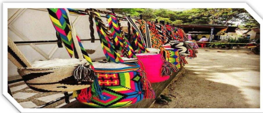
Figura N° 3. Tomada en junio del 2014