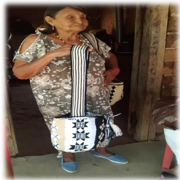
Figura N° 4. Foto tomada el 17 de octubre del 2015

Hombre Wayuú: se caracteriza por su vestuario, ya que está compuesto por: Guaireñas o alpargatas: la guaireña les recuerda los antepasados, Guayuco: es la prenda elaborada a mano y representa las castas, La keratzat : Utilizado en ocasiones especiales como bailes. La corona Wayuú tiene un valor importante, son pocas las personas que pueden colocarla sobre sus cabezas, los que poseen tal privilegio son los llamados caciques. Anónimo (2012)