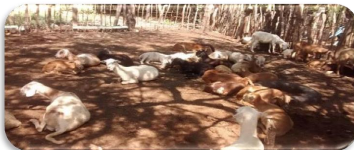
Figura N° 2. Tomada el 17 de octubre del 2015

Las actividades económicas de los Wayuú son: