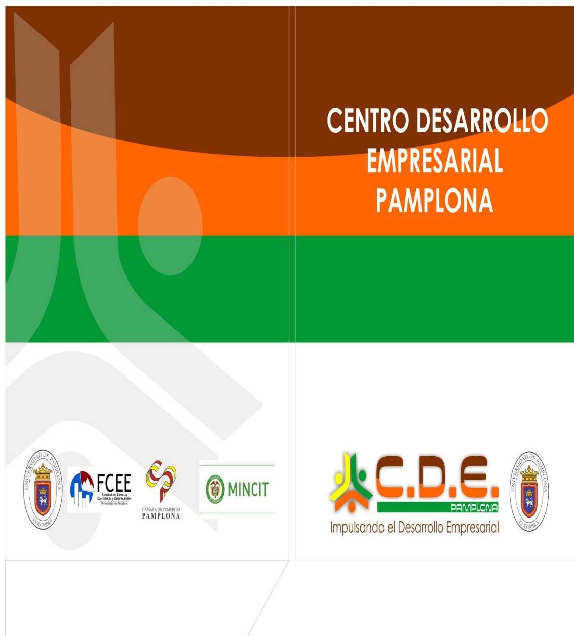
Ilustración 4: Diseño careta corporativa