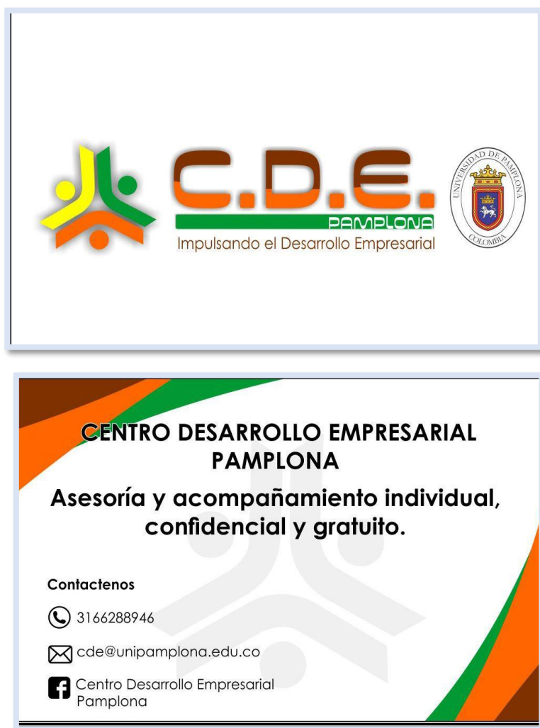
Ilustración 5: Diseño tarjeta de presentación del CDE de Pamplona.