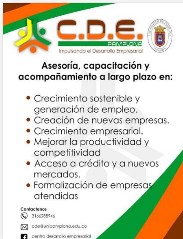
Ilustración 8: Diseño volante para CDE de Pamplona