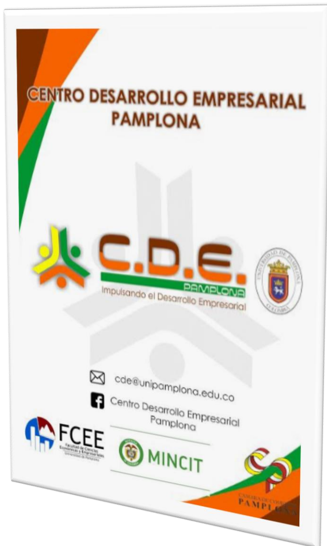
Ilustración 7: Diseño del pendón para CDE de Pamplona.