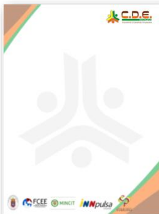
Ilustración 3: Diseño hoja membretada