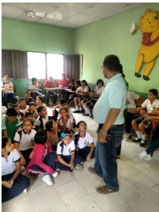
Fotografía 1. Taller de sensibilización de los mitos y leyendas del Departamento de Sucre.