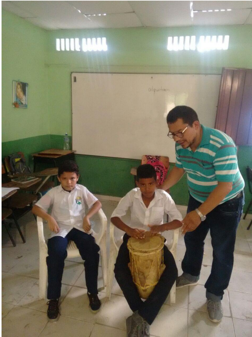
Fotografía 10. Taller de instrumentos y música tradicional sucreña.