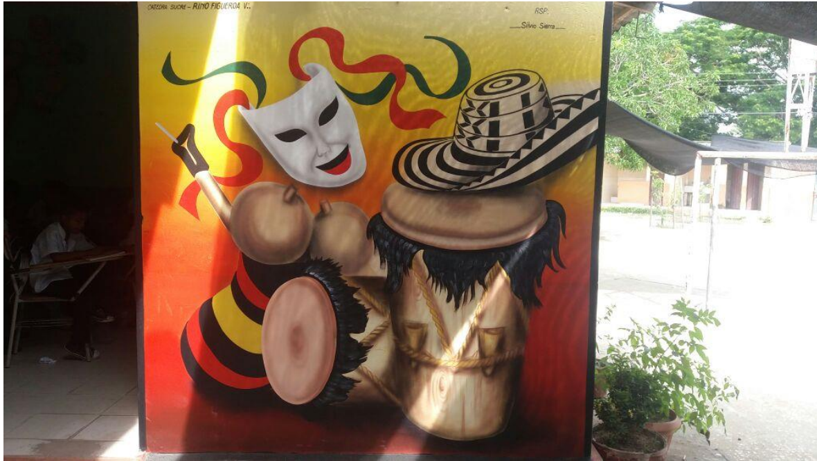
Fotografía 6. Mural alusivo a las manifestaciones culturales de Corozal