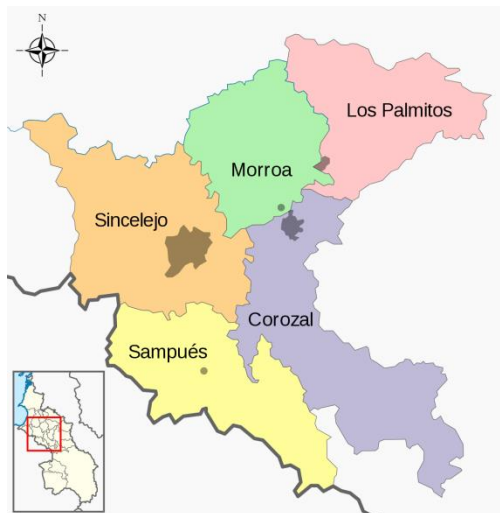
Figura 3. Mapa Ubicación geográfica de Corozal.