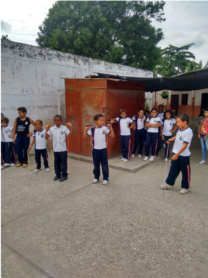
Fotografía 14. Juegos tradicionales.