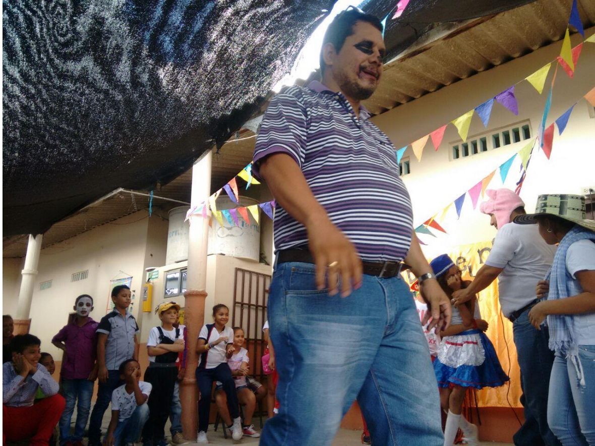
Fotografía 13. Representación de mitos y leyendas de Sucre.