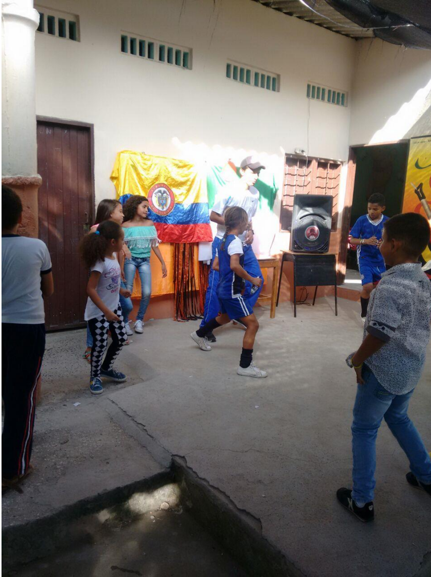
Fotografía 15. Juegos tradicionales.