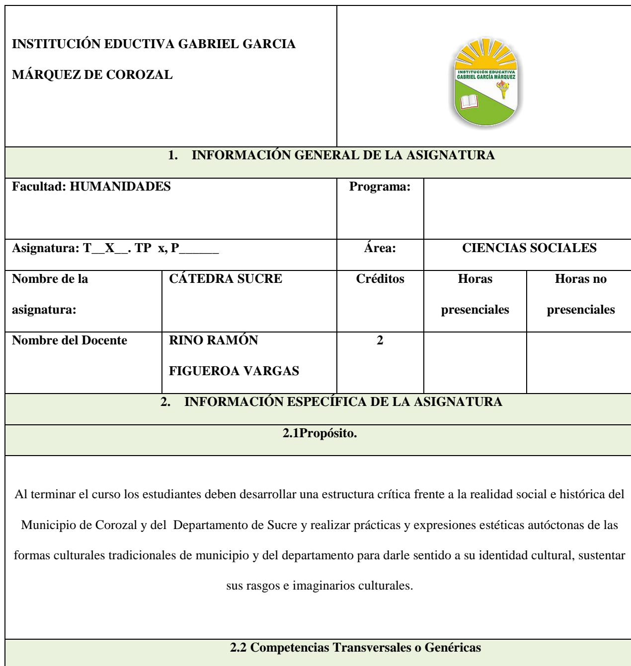
Tabla 6. Propuesta pedagógica.