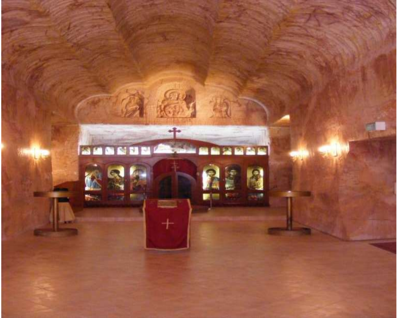
Figura 2. Iglesia subterránea en Coober Pedy, Australia. Tomado de la Web: Blog de Banderas de Schulz (2014). Un recorrido por 9 ciudades o parte de ellas bajo tierra.

Otro de estos lugares, es Derinkuyu, una de las ciudades turcas bajo el suelo; específicamente ubicada en la zona de Capadocia de Turquía; lugar que resulta atractivo e impresionante desde la percepción gráfica o contenido visual que se puede apreciar en las imágenes existentes de dicha zona. En tal sentido, es de acotar, que existen casi 40 ciudades subterráneas de miles de años de antigüedad; de las cuales, 36 se encuentran habilitadas al público y donde Derinkuyu, es una de las más grandes.