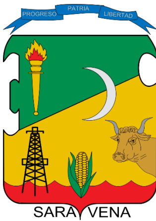
Ilustración B Escudo del Municipio de Saravena departamento de Arauca