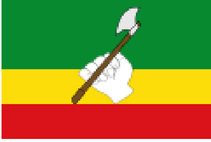
Ilustración C Bandera del municipio de Saravena departamento de Arauca