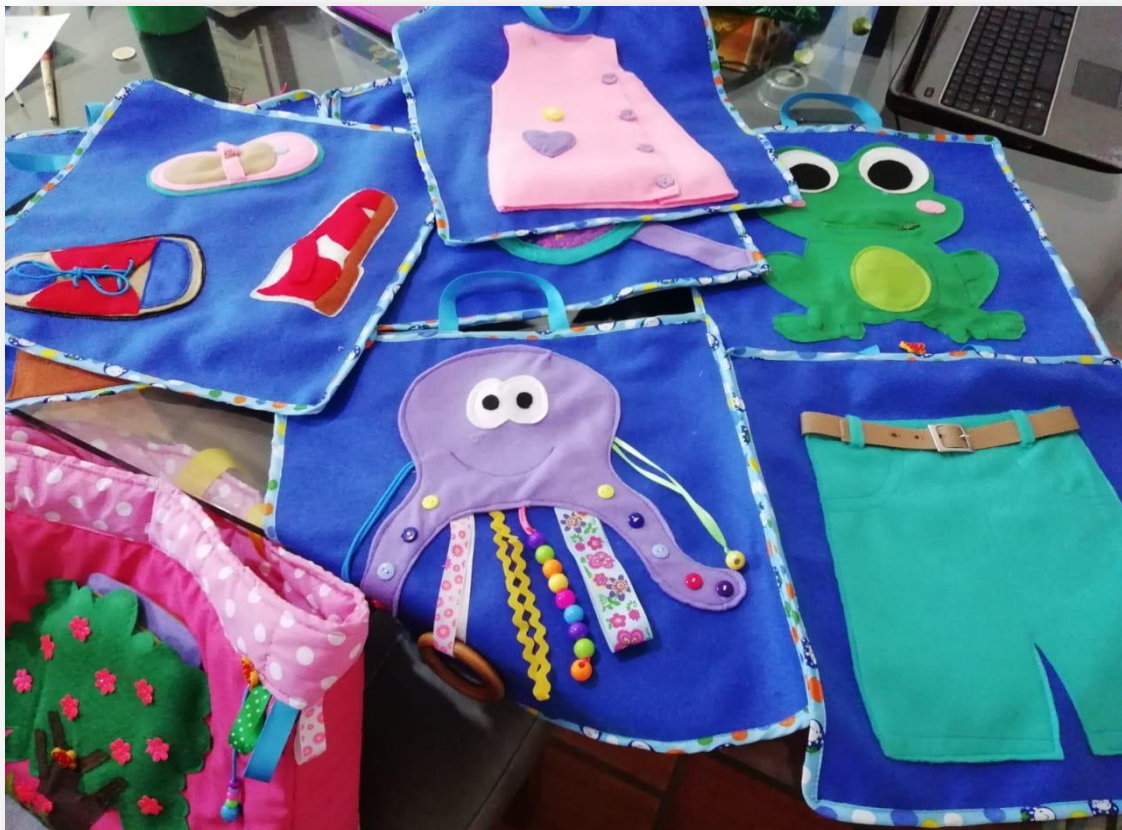
EVIDENCIA C: ROMPECABEZAS