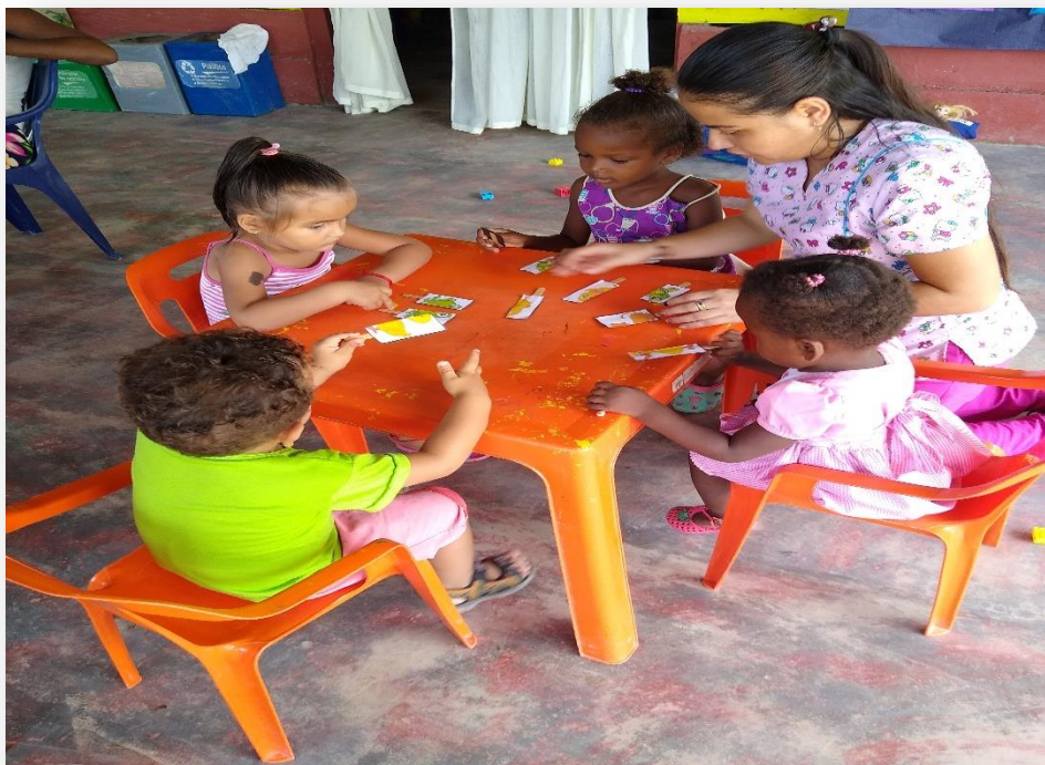
EVIDENCIA D: TUNEL DE LA ALEGRIA