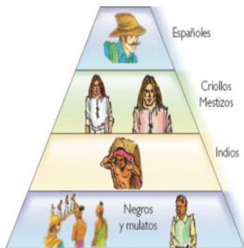
Ilustración 2. Estructura de la sociedad Colombiana durante el periodo de la colonia.

La sociedad de aquella época estaba conformada por españoles, criollos o mestizos (que eran un cruce entre indígenas y españoles), indios y negros y mulatos traídos aquí desde África durante el periodo de la esclavitud, la pirámide social entonces era así: