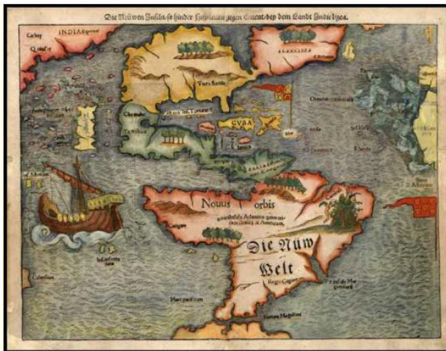
Ilustración 1 Primer mapa de América, impreso en Basilea por Sebastián Muller como parte de su Cosmografía en 1540. Tomado de: La conquista y colonización española de América. (Álvarez,

Durante este periodo hubo transformaciones de todo tipo, pues la vida y la sociedad como la conocían los nativos se acabaría para siempre. Dentro de las transformaciones más evidentes se encuentran al menos tres; de tipo étnico, religioso y económico. La historia relata pasajes de todo tipo, y es común encontrar apartados en los que, se justifica la violencia ejercida en aquellos tiempos sobre los nativos para «civilizarlos» al tiempo en que también los «cristianizaban».