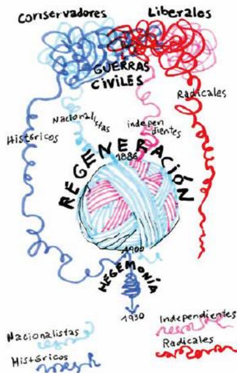
Ilustración 3 - Diagrama explicativo de la política Liberal y Conservadora en la segunda mitad del siglo XIX. Recuperado de: Biblioteca Nacional (2017). Historia de Colombia y sus Oligarquías.