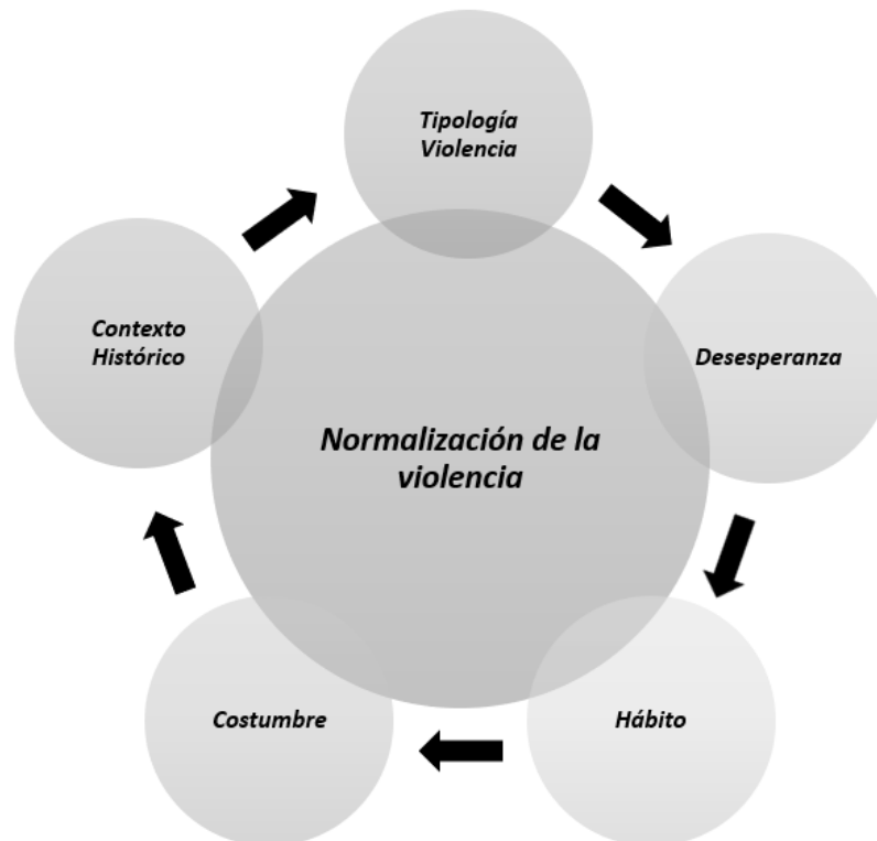
Ilustración 5. Diagrama explicativo de la violencia como un fenómeno social.

A continuación, se propone un diagrama explicativo para la mejor comprensión de las relaciones entre los diferentes apartados: