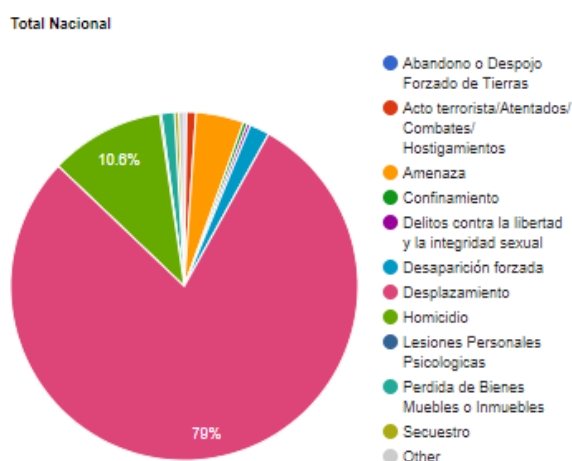
Gráfica 2. RNI – Red Nacional de Información – (2020)

De acuerdo a lo anterior, el conflicto armado ha provocado afectaciones materiales e inmateriales, que han afectado directamente a quienes padecen la violencia e indirectamente a personas que han sido testigos de estos sucesos, ya sea porque la víctima