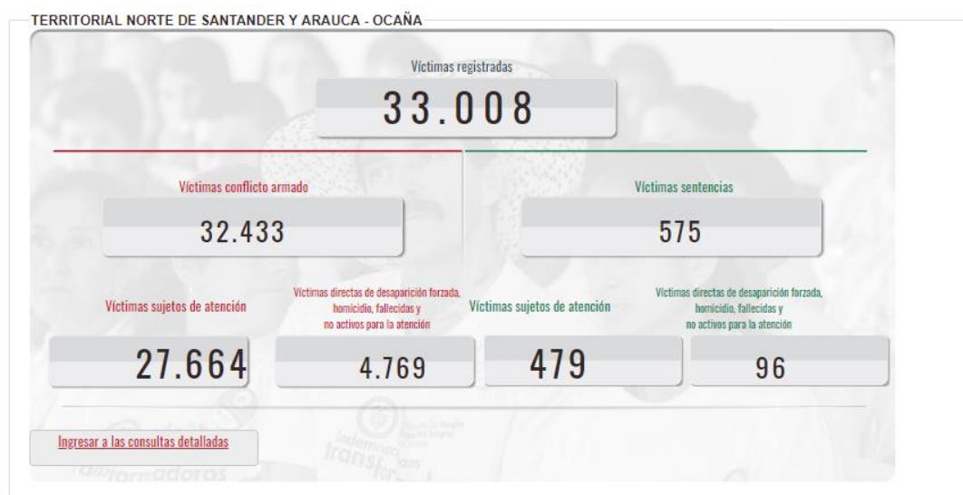
Grafica 3. Cantidad de víctimas del conflicto armado en Ocaña, Norte de Santander

Red Nacional de Información (2020). Reporte de víctimas del conflicto registradas en Ocaña, Norte de Santander