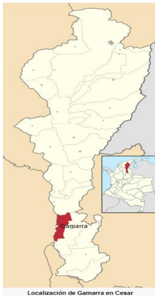
Figura 1: Mapa