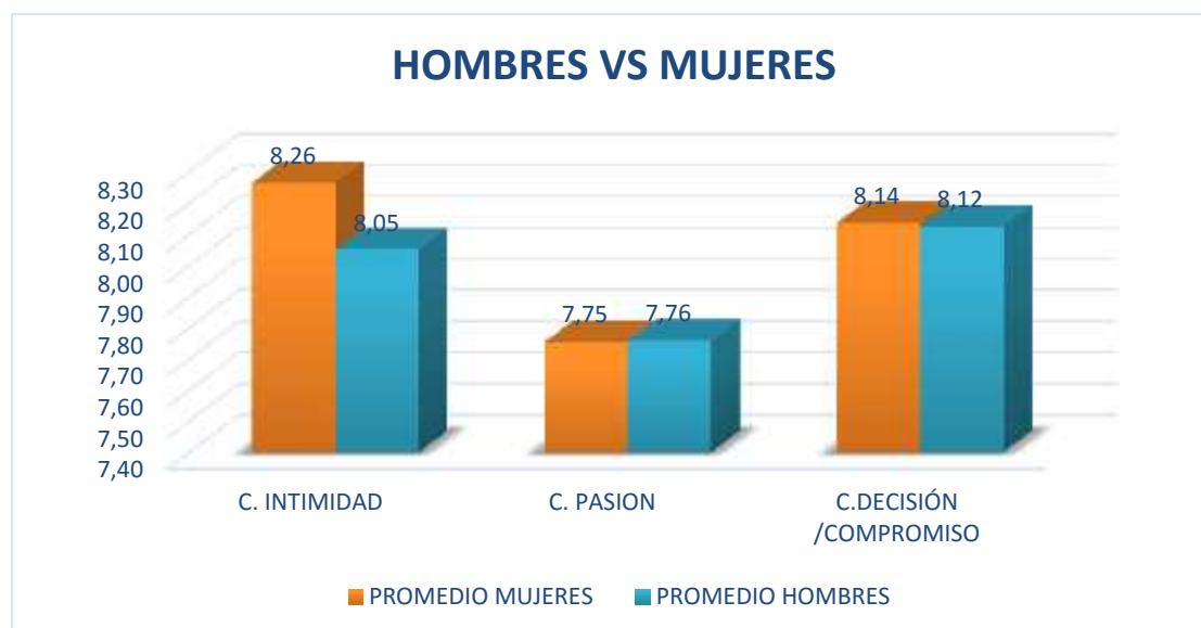
Figura 3. Diagrama del promedio de hombres y mujeres.

En la Figura 3 se evidencia las puntuaciones promedias obtenidas tanto en hombres como en mujeres, los primeros tienen una puntuación en el componente intimidad de 8,05 y las mujeres 8,26, lo cual muestra un diferencia poco significativa, en el componente de la pasión, los internos presentan un promedio de 7,76 y las mujeres 7,75, de éstos no se perciben diferencias, de igual manera sucede en el componente decisión/ compromiso, las mujeres tienen una puntuación de 8,14 y los hombres de 8,12. De los resultados anteriores se puede percibir que la pasión tiene un valor por debajo del componente intimidad y decisión/ compromiso, sin embargo, se considera una puntuación alta.