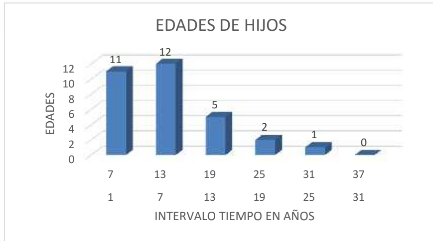
Figura 7. Edad del hijo mayor de los internos

En la Figura 7 se percibe que la mayor parte de los internos tienen hijos en edades comprendidas entre los 1 a 13 años, 11 internos tienen hijos de 1 a 7 años y 12 de 7 a 13 años, son pocos los que tienen con edades superiores a la mencionada.