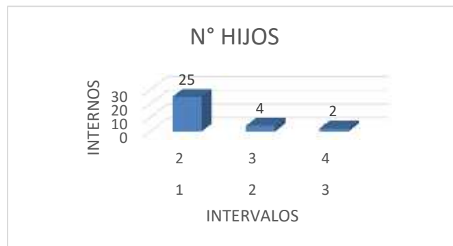
Figura 6. Cantidad de hijos por pareja.

En la presente Figura muestra las duraciones de las relaciones de pareja en internos, en ella se puede apreciar que la mayor parte de ellos tienen relaciones con una duración de 1 a 11 años, el resto de los internos presentan relaciones con un tiempo superior al mencionado.