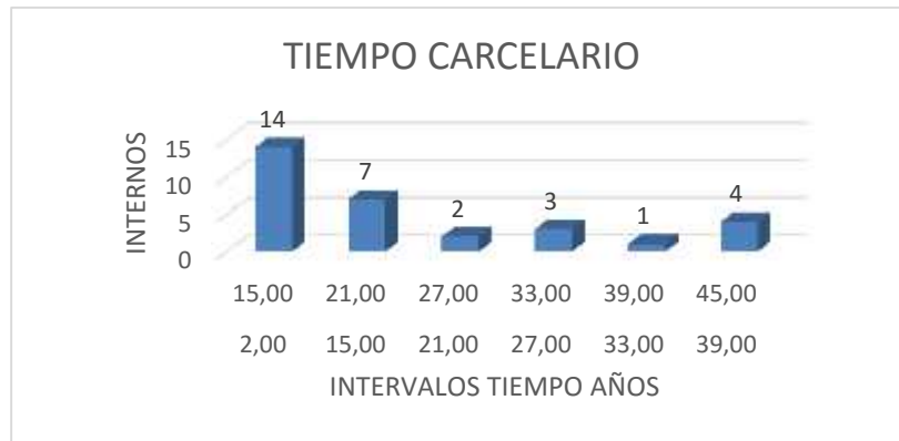
Figura 8. Estancia de los internos en el EPMS de Pamplona

En la Figura 7 se percibe que la mayor parte de los internos tienen hijos en edades comprendidas entre los 1 a 13 años, 11 internos tienen hijos de 1 a 7 años y 12 de 7 a 13 años, son pocos los que tienen con edades superiores a la mencionada.