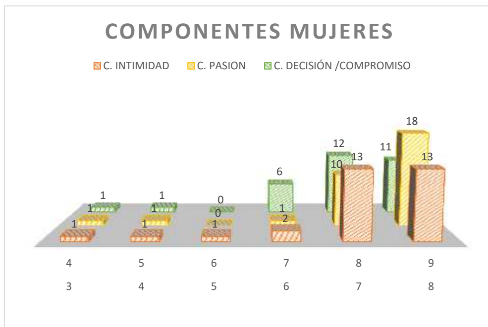
Figura 2. Diagrama de resultados de las mujeres en los tres componentes

A continuación se encuentra representados gráficamente los resultados de las mujeres en lo componentes: Intimidad, pasión, decisión/compromiso.