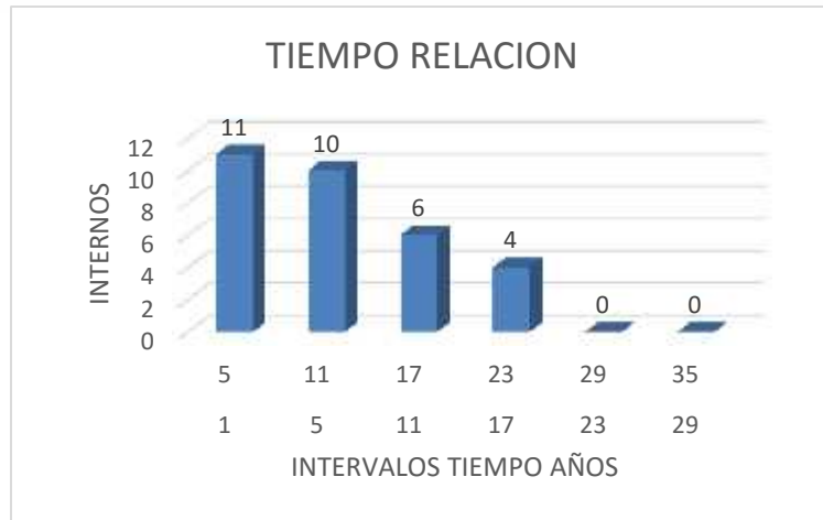
Figura 5. Duración de las relaciones de pareja.

En la presente Figura muestra las duraciones de las relaciones de pareja en internos, en ella se puede apreciar que la mayor parte de ellos tienen relaciones con una duración de 1 a 11 años, el resto de los internos presentan relaciones con un tiempo superior al mencionado.