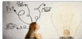
Figura 7. Heredia, (2014). El camino de creación

El Proyecto de Vida es la estructura que expresa la apertura de la persona hacia el