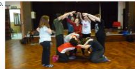
Figura 4. Ignacio, (2014). Poner el cuerpo a la opresión.