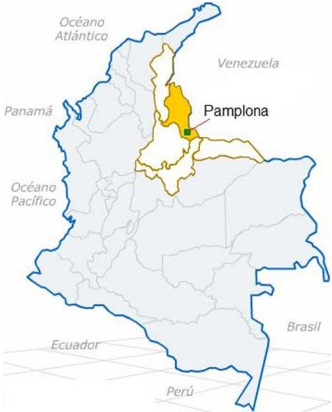
Figura 1 Ubicación de Pamplona.