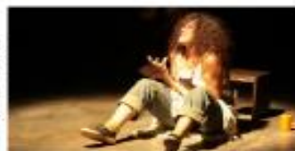
Figura 3. Medina, (2018). Nudo en el estómago

En esta primera parte se llevará a cabo un entrenamiento corporal para superar bloqueos durante la actuación y generar un clima de confianza con sí mismo y con el grupo, estimulando el potencial creativo.