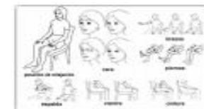
Figura 4. Pico, (2018). Relajación progresiva