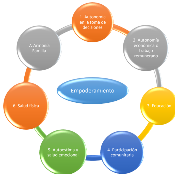
Figura 1. Dimensiones del empoderamiento.

No obstante, de acuerdo con Donoso Trinidad (2018), también está conformado por la dimensión subjetiva, denominada “poder interno”, permitiendo desarrollar la autoestima y la confianza necesaria para cambiar la situación de subordinación. Siendo la autoestima, una variable indispensable respecto a la autoeficacia y expectativa de control. En la siguiente gráfica, se resumen dichas dimensiones que hacen parte en la construcción de herramientas que convengan a la figura femenina, en el desarrollo de sus destrezas en el ámbito social, propuestos por Donoso Trinidad (2018)