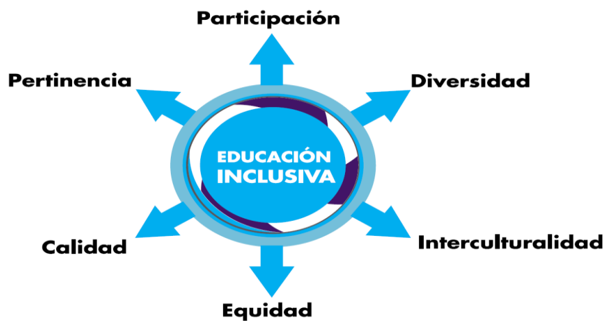
Figura 1. Características de la educación inclusiva