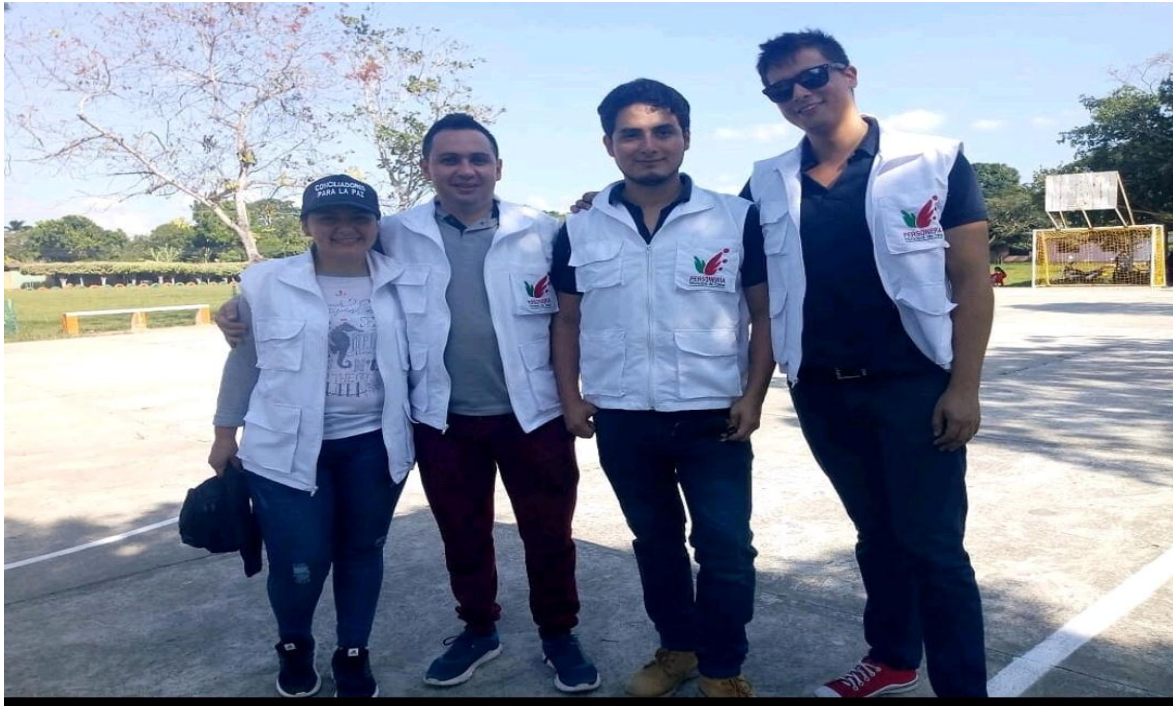
PERSONEROS DEL MUNICIPIO DE TAME, ARAUCA Y ASESORES JURIDICOS DE LA PERSONERIA