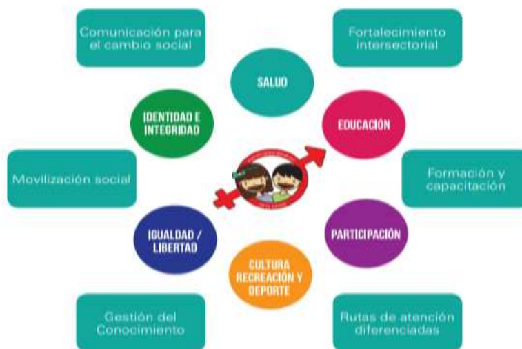
Figura 1. Estrategia de Prevención del embarazo en la adolescencia, ICBF