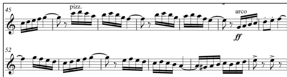
Ilustración 14 Pepita Greus, compás 45 al 57 Violín

Terminado el solo de la obra, justo después vuelvo a incluir el staccatissimo , esta vez en notas muy agudas: