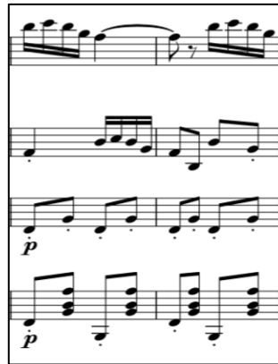
Ilustración 8 Pepita Greus, compás 47 al 48 Score

En el compás 47 al 50, la voz que le correspondía al laúd se la cedí a la bandurria, para que las respuestas de la melodía del violín quedaran con un registro más conforme a la secuencia del fraseo y al laúd le añadí un motivo rítmico en función de marcar los bajos de los acordes que hace la guitarra: