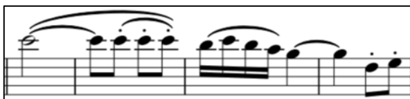
Ilustración 13 Pepita Greus, compás 33 al 36 Violín

En el compás 33 y 34 empleo un staccato 10 ligado y en el 36 aparece el primer spiccato 11 en las 2 últimas corcheas: