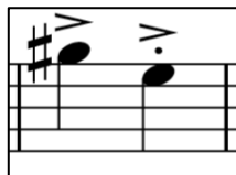
Ilustración 10 Pepita Greus, compás 3 Violín

En la adaptación al violín, la melodía no se modifica, excepto algunas ligaduras a la hora de implementar algunos golpes de arco. Inicialmente en el fraseo de la introducción, justo después de la primera negra acentuada añadí un martelé 7 :