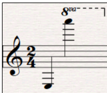
Ilustración 1 Tesitura