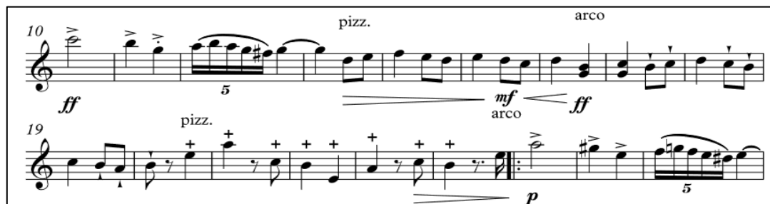
Ilustración 12 Pepita Greus, compás 10 al 27 Violín

Después de esta secuencia pizzicato en el compás 17 implementé el staccatissimo 9 en una serie de corcheas y luego pizzicato de la mano izquierda: