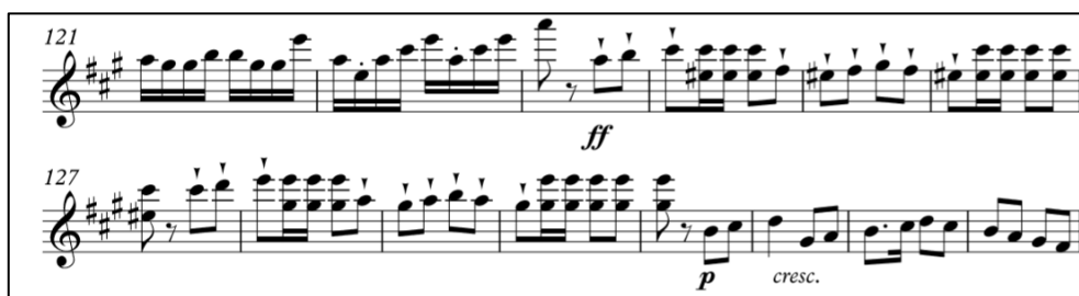
Ilustración 15 Pepita Greus, compás 121 al 134 Violín

Terminado el solo de la obra, justo después vuelvo a incluir el staccatissimo , esta vez en notas muy agudas: