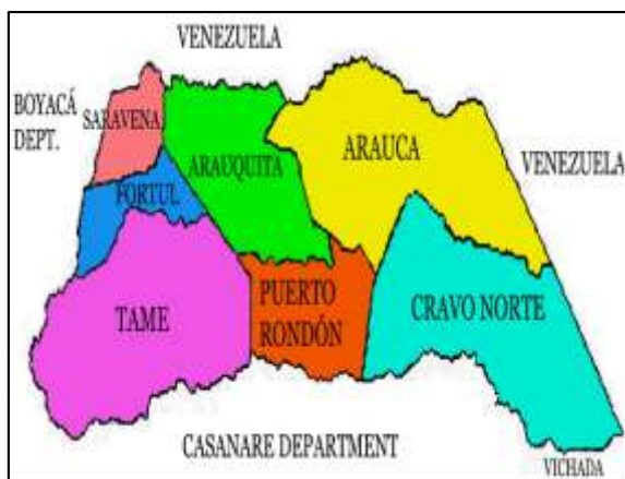
Imagen N° 1: Departamento de Arauca

Tiene como visión dirigir todas las acciones de la institución educativa estando enmarcadas en los retos propuestos por la Constitución nacional de 1991: “construir un nuevo país formando un nuevo ciudadano. Por otro lado, la misión se define, dentro del marco de la Ley general de educación y las exigencias de la realidad, los principios, fundamentos y fines de la institución, dando líneas de acción que cohesionan el ser y el hacer de la comunidad educativa.