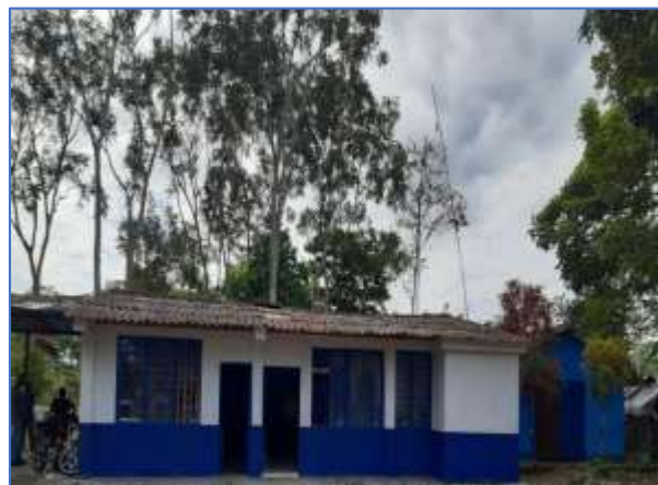
Imagen N° 2: Escuela La arenosa