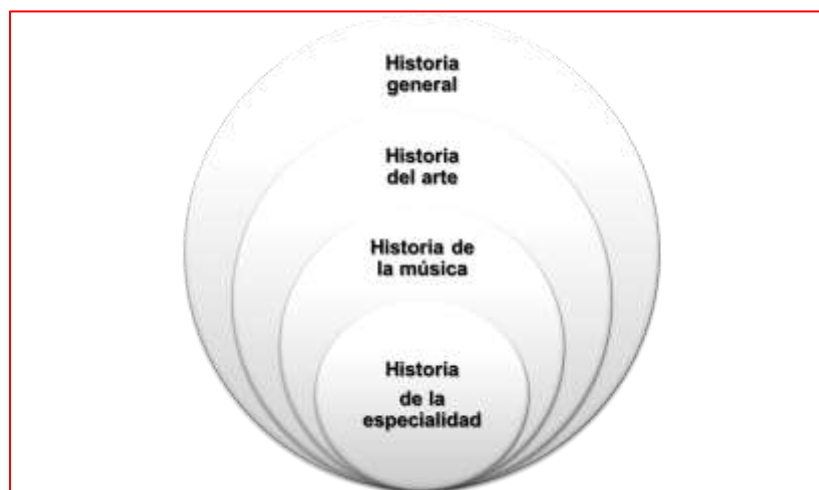
Imagen 2 y 3 Disciplinas afines más aplicadas en el proceso de interpretación musical. María León 2021