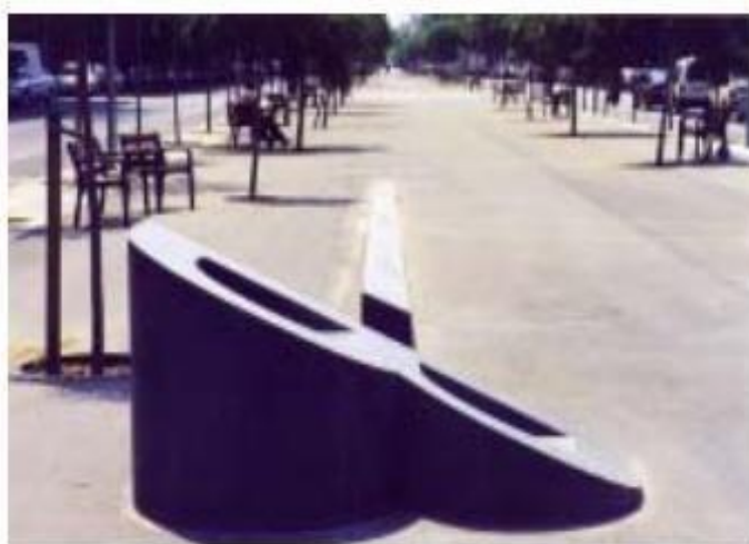
La Línea de la Verneda

Nota. Esta obra hace parte de la historia de la comunidad de Verneda ubicada en