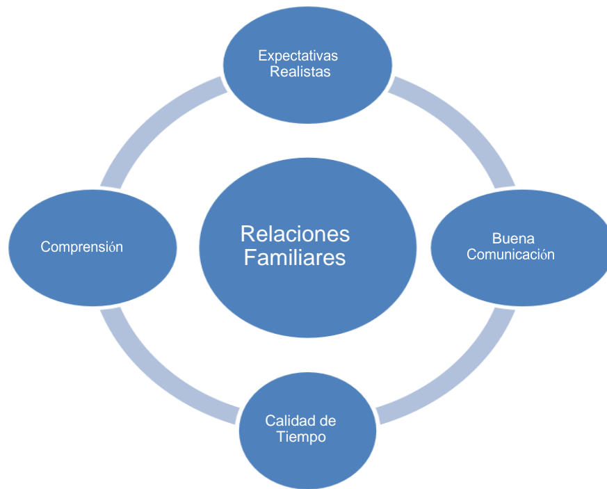
Figura 1. Aspectos básicos en las relaciones familiares. Fuente; Autor, partiendo de (Pliego,2013).