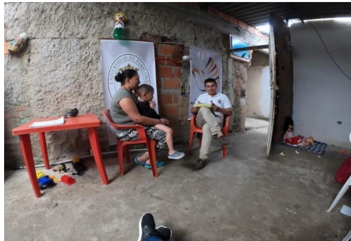
Figura 7. Aplicación de técnicas objetivo 1, realización de Entrevista Semiestructurada a padres de familia.

En la información obtenida de Los padres de familia (Figura 7) sobre los estudiantes del grado décimo de la I.E Cayetano Franco Pinzón se observa que el promedio de integrantes por familia es superior al promedio nacional. En cuanto al tipo de familia se registran familias nucleares, monoparentales y familias de tres generaciones o extensas ( Tabla 5 ), se debe agregar que las 16 familias entrevistadas están conformadas por 92 integrantes, 60 hijos y 32 parentales, de los hijos el 96.6 % han vivido hechos de violencia directa, y hacen parte del registro a nivel municipal de las 8.120 víctimas y nacional de 8.553.416 víctimas ( Tabla 6 ) del conflicto armado (Unidad de Victimias, 2020).