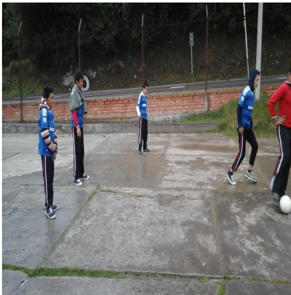
CAMPEONATO FUTBOL SALA