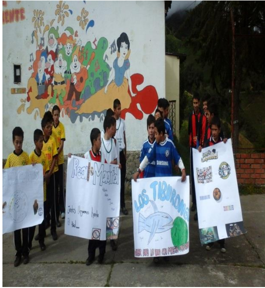
CAMPEONATO FUTBOL SALA

Universidad de Pamplona Pamplona - Norte de Santander - Colombia Tels: (7) 5685303 - 5685304 - 5685305 - Fax: 5682750 - www.unipamplona.edu.co