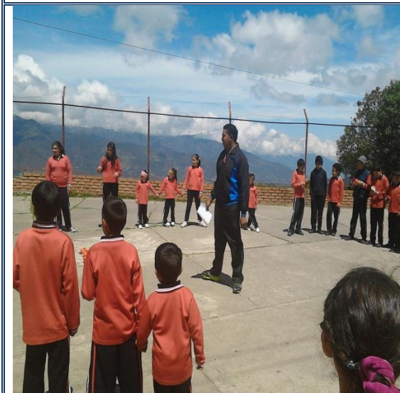
CLASE EDUCACIÓN FÍSICA