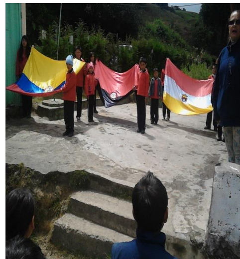
IZADA DE BANDERA