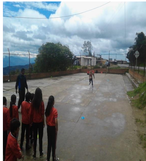
CLASE DE EDUCACIÓN FÍSICA