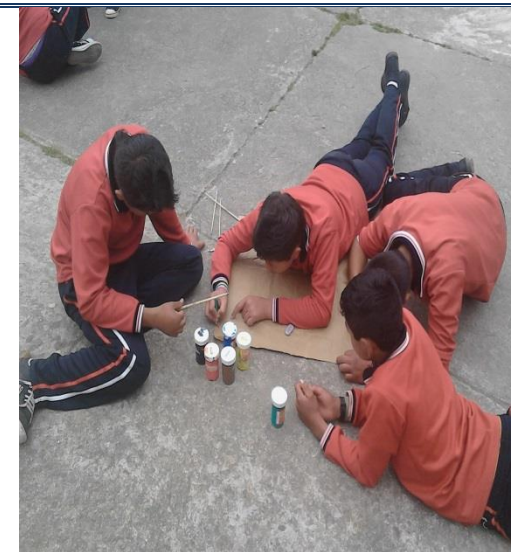
CLASE EDUCACIÓN FÍSICA