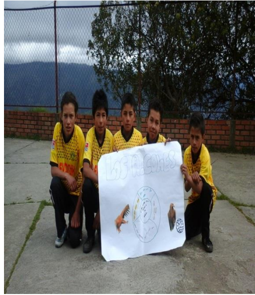
CAMPEONATO FUTBOL SALA