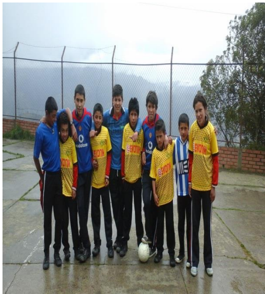
CAMPEONATO FUTBOL SALA