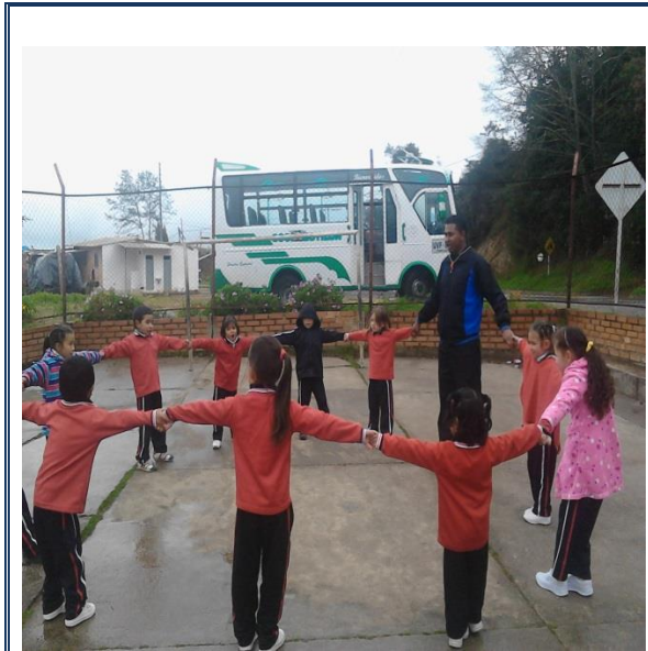
CLASE DE EDUCACIÓN FÍSICA

Universidad de Pamplona Pamplona - Norte de Santander - Colombia Tels: (7) 5685303 - 5685304 - 5685305 - Fax: 5682750 - www.unipamplona.edu.co