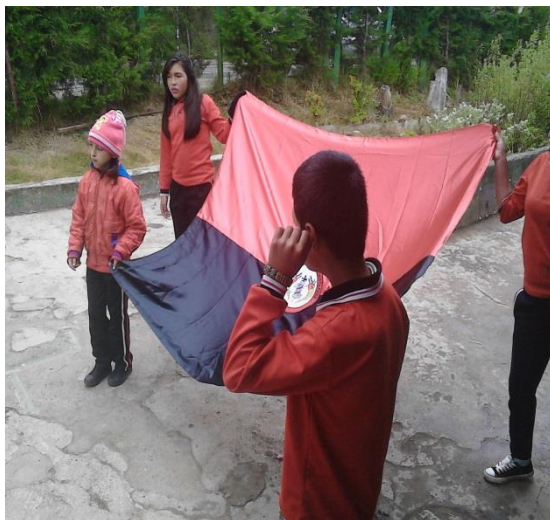
IZADA DE BANDERA