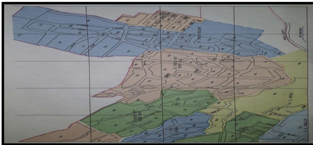
Figura 1: Mapa del Barrio Cristo Rey