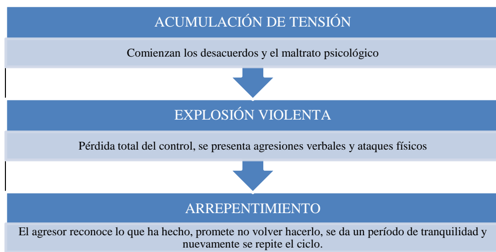
Figura4.Fases de la Violencia Intrafamiliar

Para mayor comprensión de la violencia intrafamiliar es necesario analizar el siguiente esquema (figura 4) que nos muestra las diferentes etapas evolutivas de este tipo de violencia.