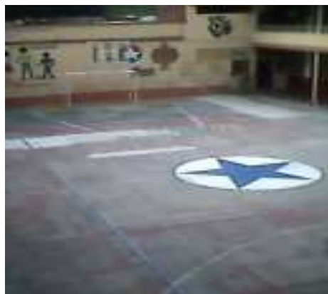
SALA DE INFORMATICA