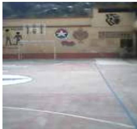
SALA DE BILINGUISMO