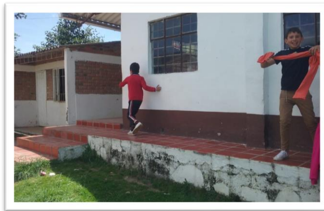
Figura 2 Vista lateral de la institución.