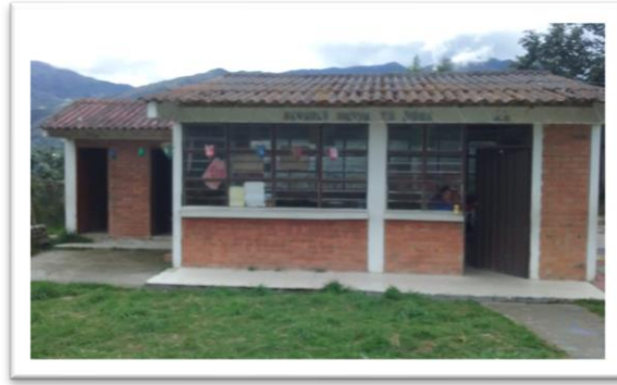
Figura 1 Vista frontal del Centro Educativo Rural Sucre.