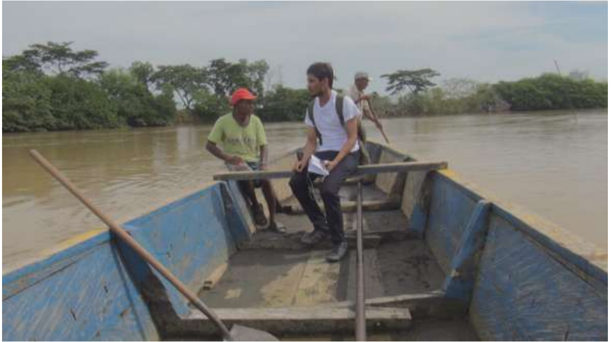
Día uno de filmación