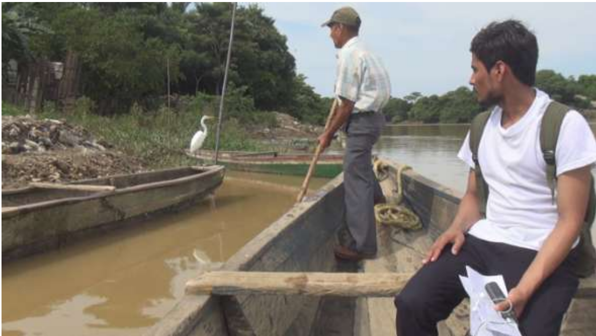
Día dos de filmación