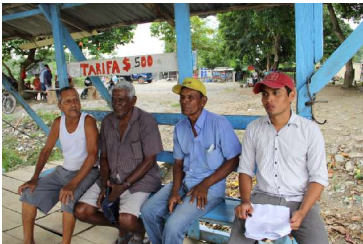
Entrevista a los areneros de primera generación en la etapa de preproducción