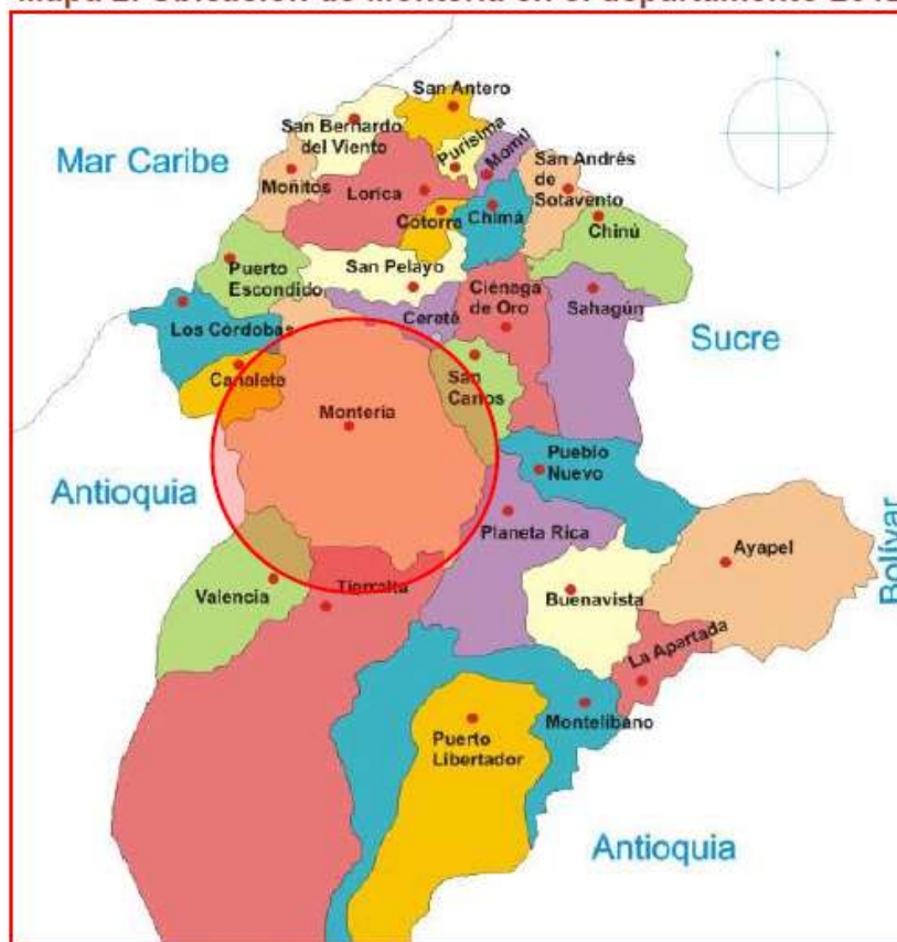
Mapa 2. Ubicación de Montería en el departamento 2012