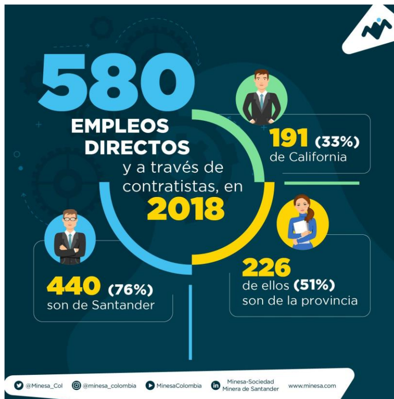
Figura 1 Diagrama de datos empleos MINESA 2018

Por otro lado encontramos que dentro de los resultados obtenidos de la indagación de datos se evidencia que a partir de la llegada de la mega minería a tierras del municipio de California (S), se han generado problemáticas que se han venido aumentando como lo son el desempleo el cual oscila en el 67% de personas mayores de 18 años entre hombre y mujeres californianas, por lo cual esta problemática es detallada en primer lugar por la delimitación de paramo establecido en el artículo 202 de la Ley 1450 de 2011 el cual refiere y ordena al ministerio de ambiente delimitar los páramos que están a una escala 1:25.000 metros. De igual forma, el numeral 16 del artículo 2 del Decreto-Ley 3570 de 2011, en segundo lugar, por la llegada masiva de personas aledañas al municipio ya sea de la región, departamento, país e incluso extranjeras, en tercer lugar, encontramos la clasificación de la mano de obra calificada y no calificada, es aquí donde evidenciamos la exclusión que se realiza con los habitantes pertenecientes al municipio.