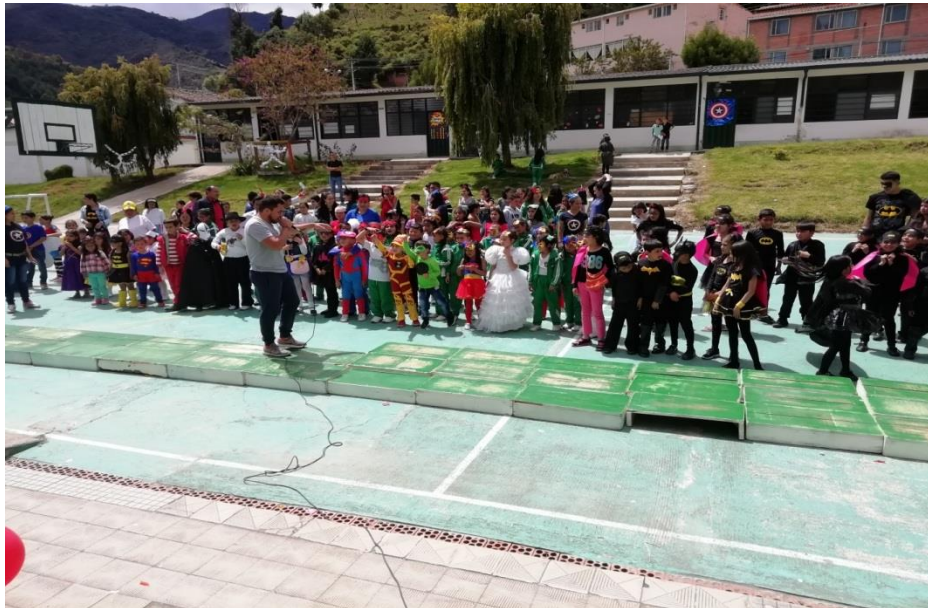
DIA DEL NIÑO