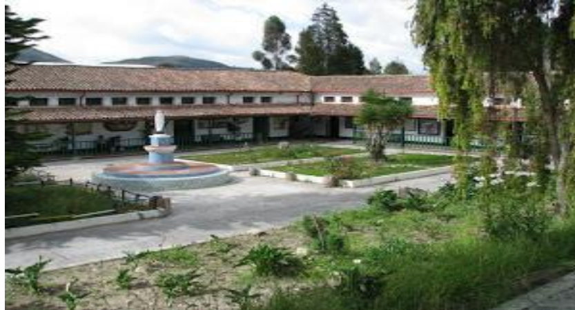
NORMAL SUPERIOR DE PAMPLONA