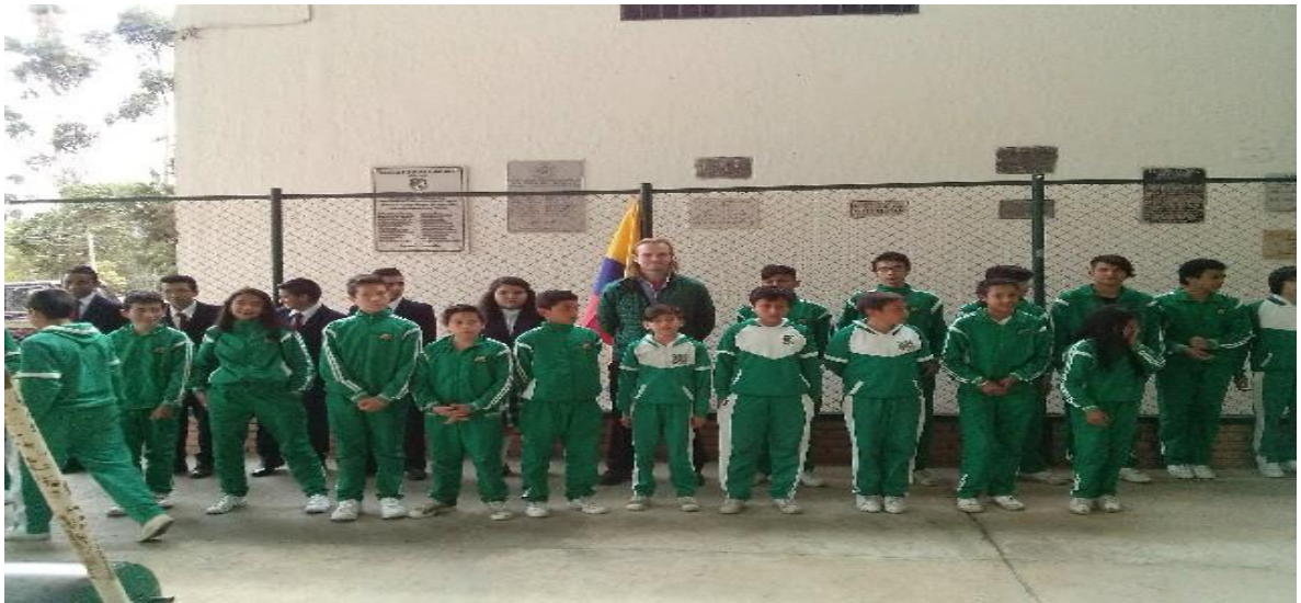
UNIFORME DE EDUCACION FISICA

UNIFORME PARA EL PROGRAMA DE FORMACIÓN COMPLEMENTARIA Sudadera azul con franjas blancas y Verdes y cami-buso blanco, tenis blancos o azules, según modelo aprobado por el grupo de Estudiantes del Respectivo Semestre.