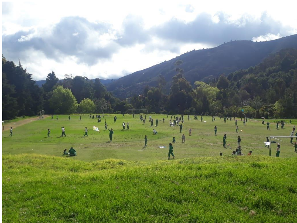
DIA DE COMETAS