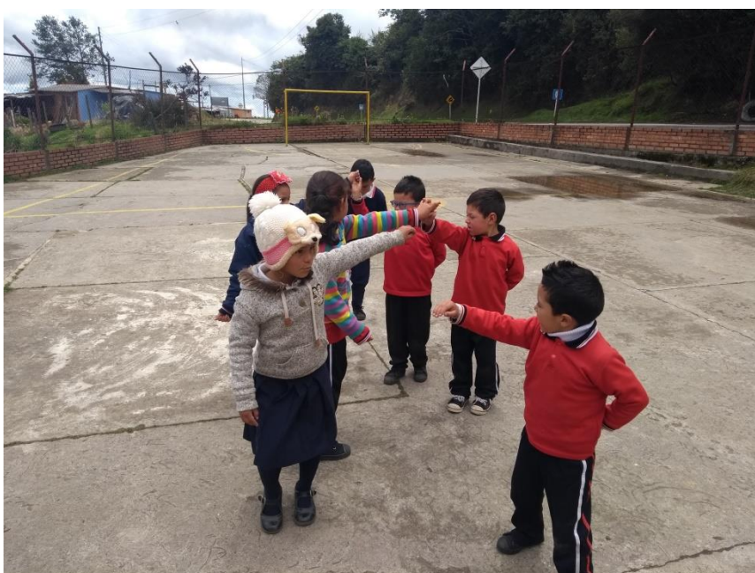
Clase de danza con grados 1-2