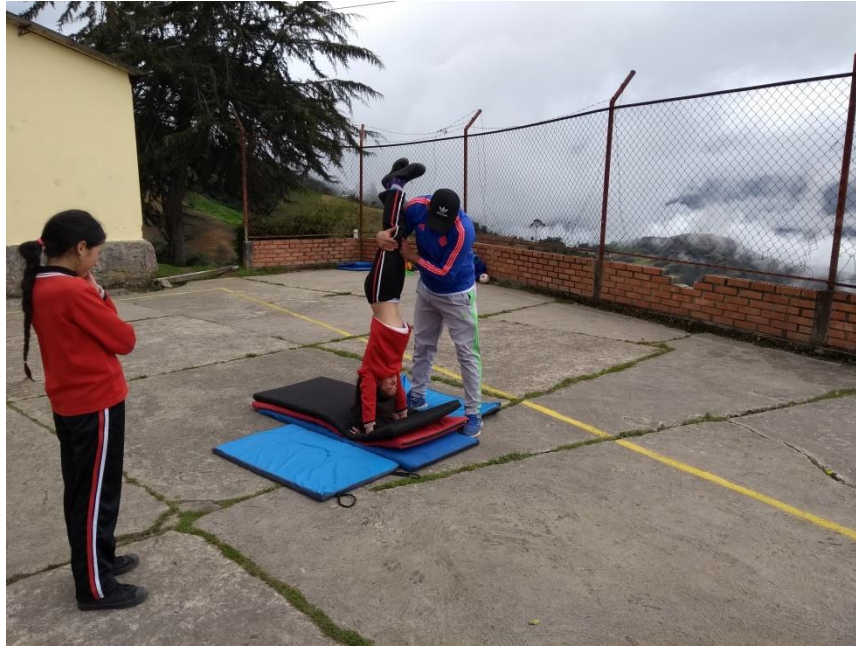
Pada de manos

Universidad de Pamplona Pamplona - Norte de Santander - Colombia Tels: (7) 5685303 - 5685304 - 5685305 - Fax: 5682750 - www.unipamplona.edu.co