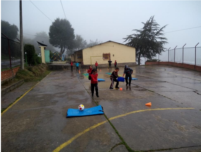
Circuito para mejorar el trabajo en equipo por parejas

Universidad de Pamplona Pamplona - Norte de Santander - Colombia Tels: (7) 5685303 - 5685304 - 5685305 - Fax: 5682750 - www.unipamplona.edu.co