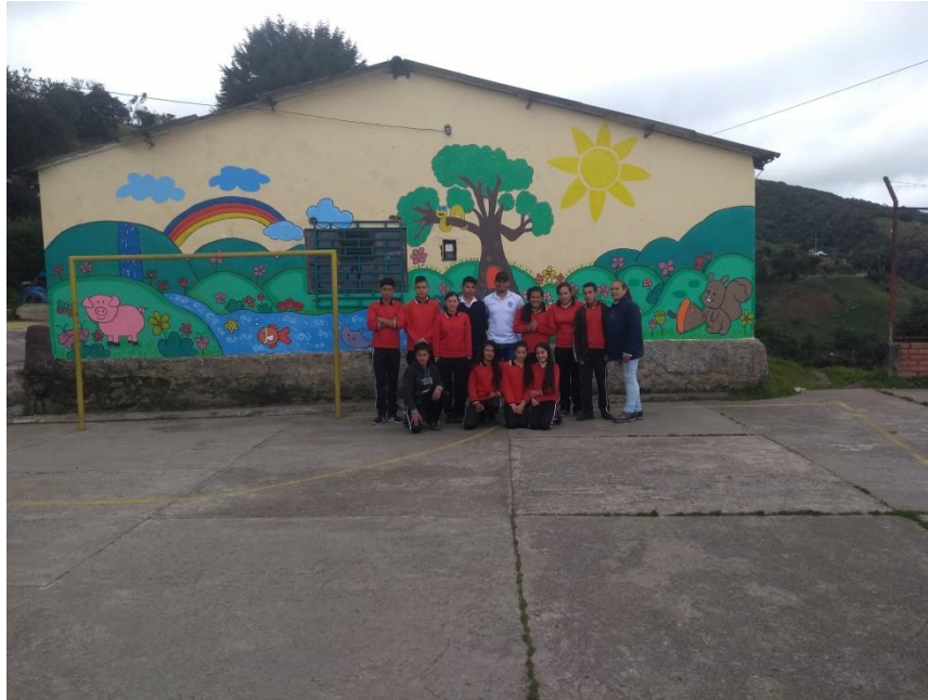
Despedida con los estudiantes y docente de telesecundaria

Universidad de Pamplona Pamplona - Norte de Santander - Colombia Tels: (7) 5685303 - 5685304 - 5685305 - Fax: 5682750 - www.unipamplona.edu.co