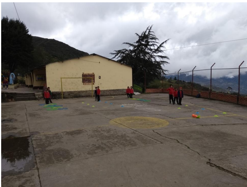
Habilidades motrices por estaciones

Universidad de Pamplona Pamplona - Norte de Santander - Colombia Tels: (7) 5685303 - 5685304 - 5685305 - Fax: 5682750 - www.unipamplona.edu.co