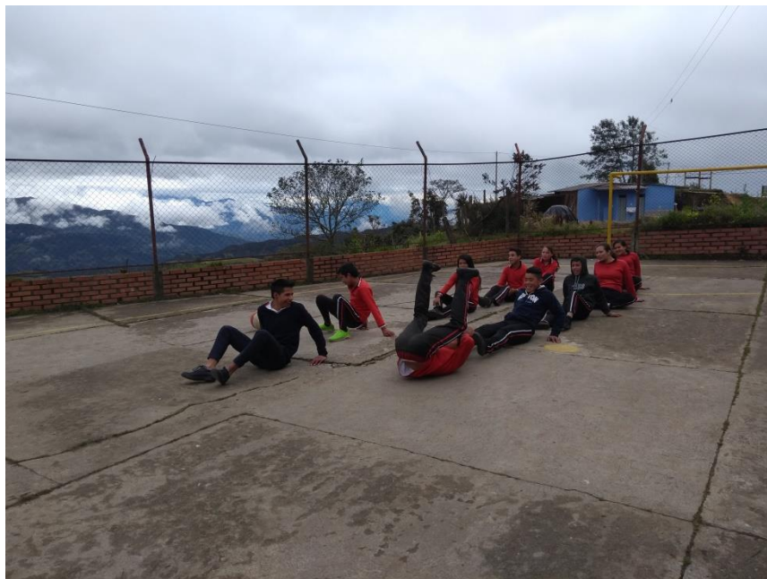
Juego para romper el hielo con los de secundaria