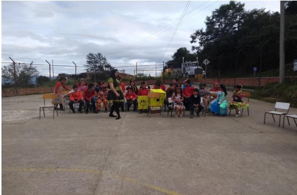
13 DE NOVIEMBRE INICIO DE NOVENA NAVIDEÑA

Universidad de Pamplona Pamplona - Norte de Santander - Colombia Tels: (7) 5685303 - 5685304 - 5685305 - Fax: 5682750 - www.unipamplona.edu.co