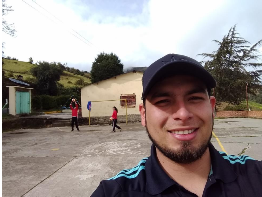
Clase de voleibol

Universidad de Pamplona Pamplona - Norte de Santander - Colombia Tels: (7) 5685303 - 5685304 - 5685305 - Fax: 5682750 - www.unipamplona.edu.co