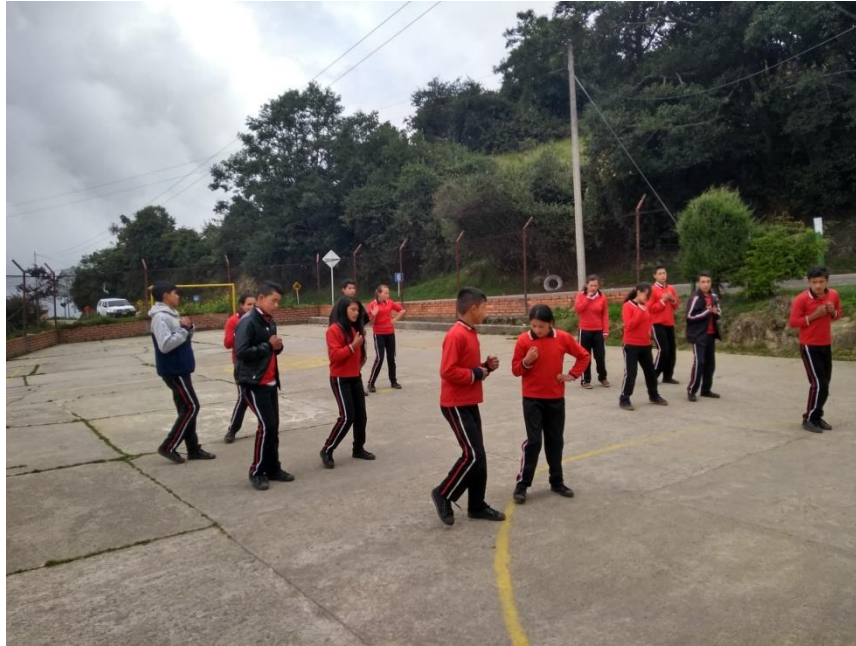
Clase de danza telesecundaria

Universidad de Pamplona Pamplona - Norte de Santander - Colombia Tels: (7) 5685303 - 5685304 - 5685305 - Fax: 5682750 - www.unipamplona.edu.co