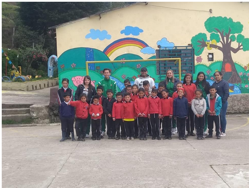
Despedida con estudiantes, docente y demás practicantes de primaria