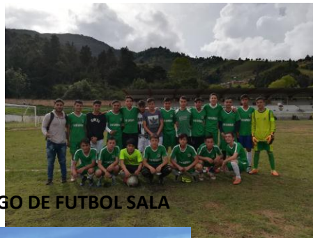
CAMPEONATO RELAMPAGO DE FUTBOL SALA