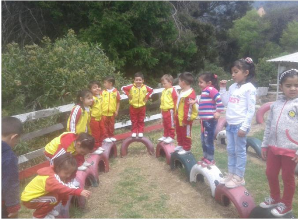
EQUILIBRIO SOBRE LLANTAS