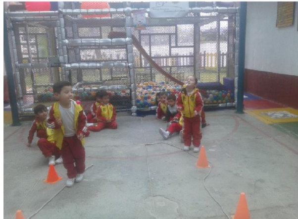
CUCHARA A LA BCA