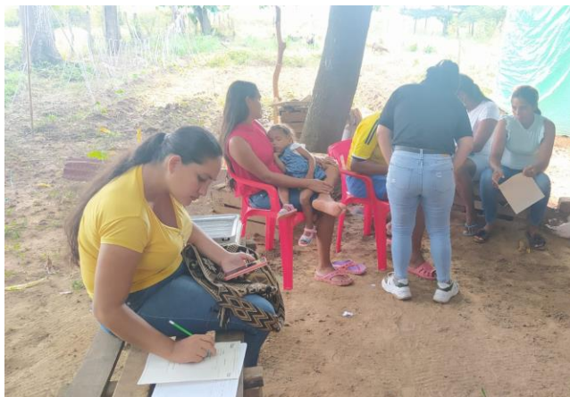
Ejercicios de liquidación de lotes