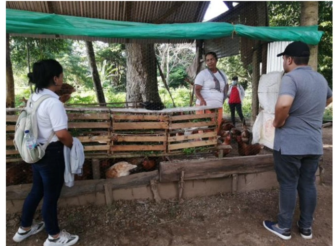
Visita a los galpones