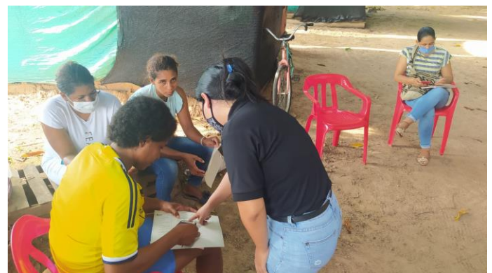
Ejercicios de simulacro con registros productivos