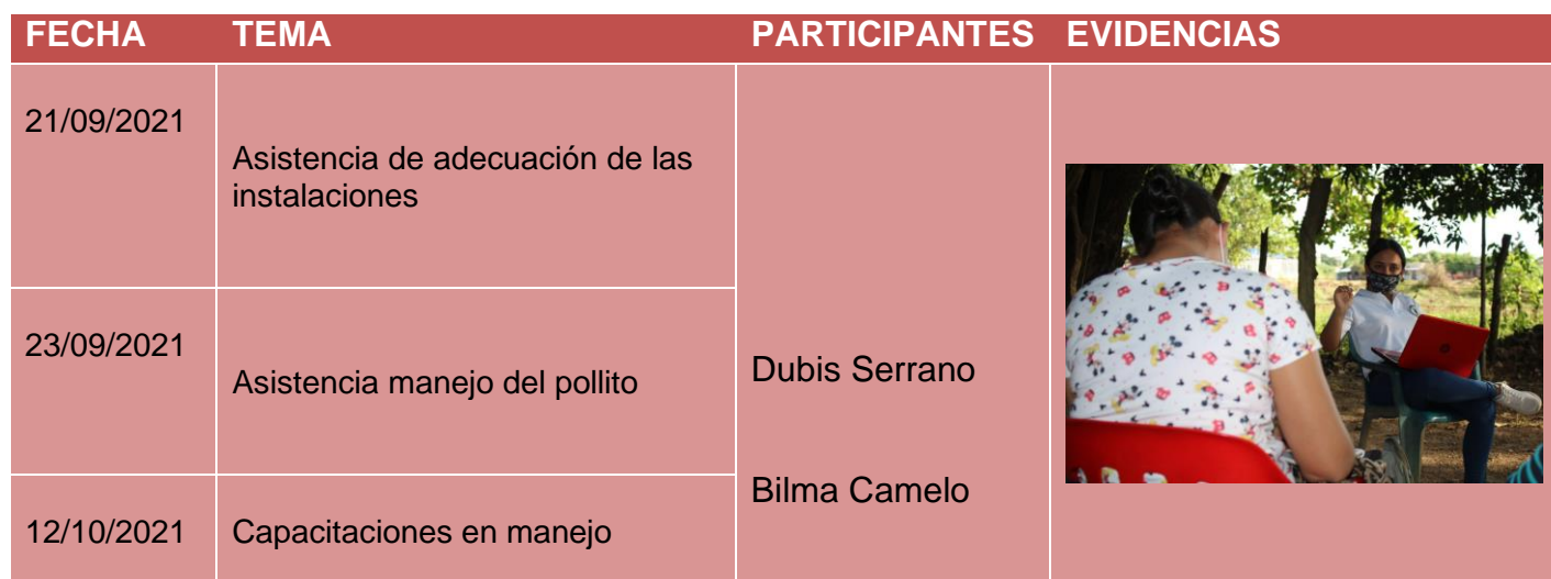
Tabla 4. Listado de capacitaciones técnicas