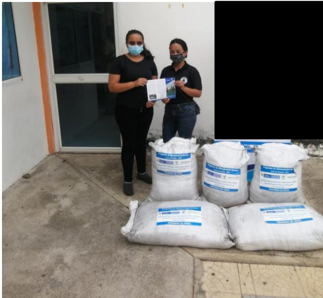
Entrega de insumos