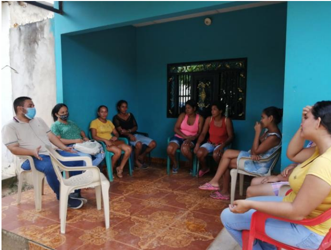
Socialización del sistema de producción