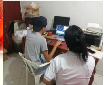
Elaboración de imagen publicitaria y de mercadeo