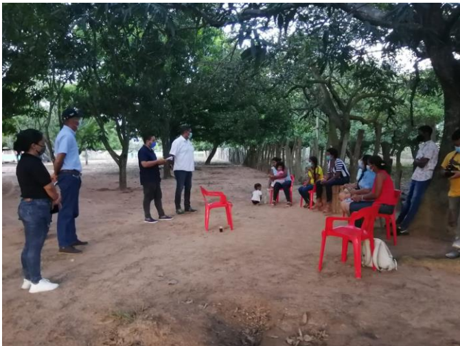
Asistencia técnica y asesoría