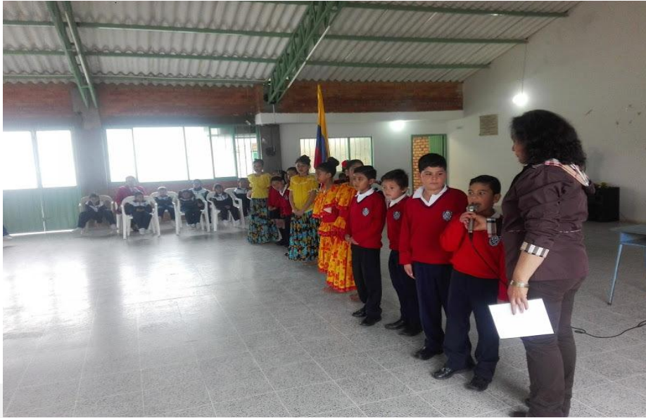
Viacrucis 7 de Abril