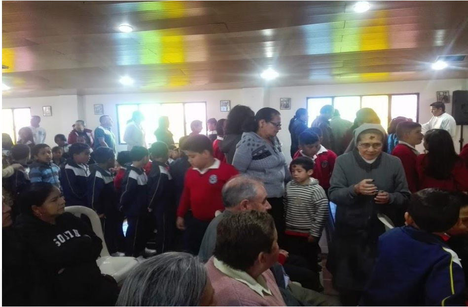
Izada de Bandera 17 de marzo