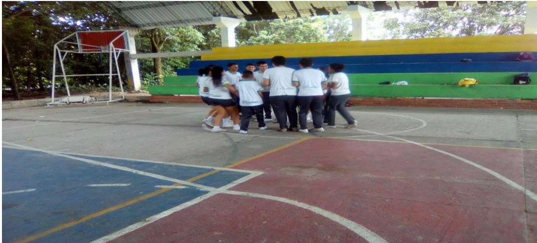
JUEGOS DE CALENTAMIENTO