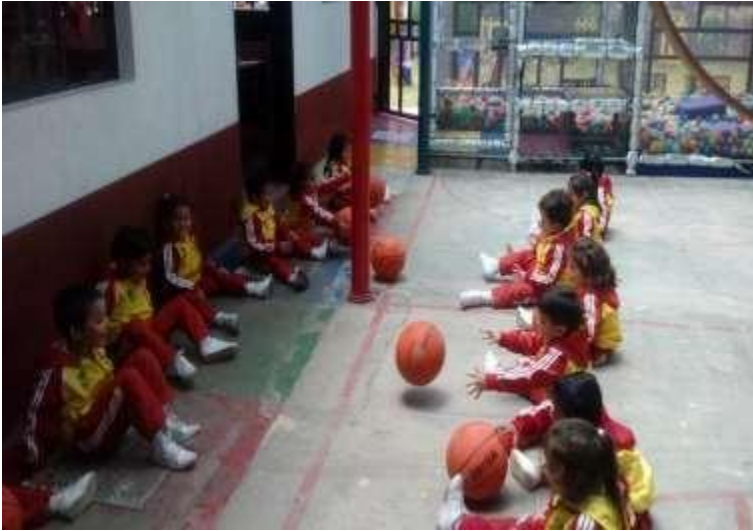
LANZAMIENTO DE PELOTAS