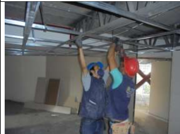
Fotografía 69. Instalación de estructura para cielo raso