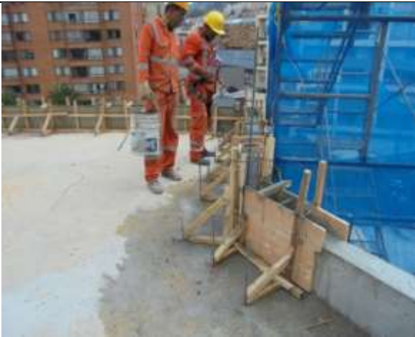
Fotografía 27. Construcción de bordillo en cubierta