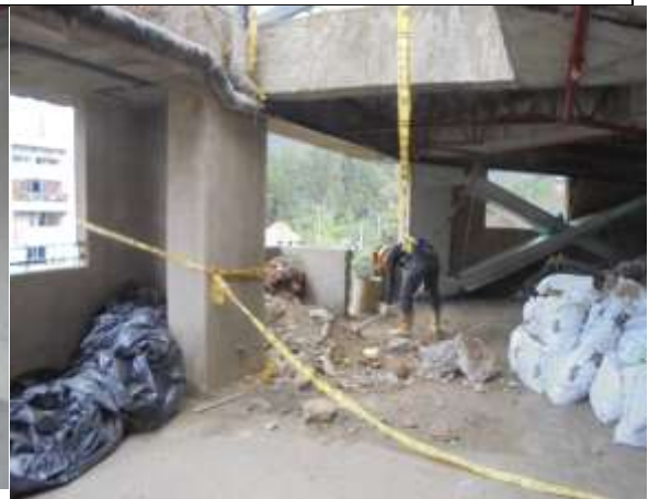
Fotografía 48. Trasiego y acopio de escombros