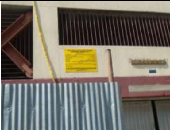
Fotografía 17. Instalación de valla informativa