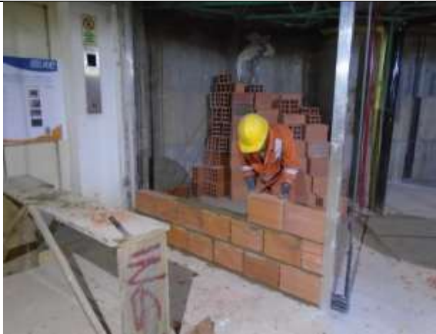
Fotografía 21. Mampostería en sótano