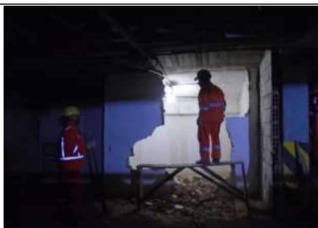
Fotografía 11. Demolición de mampostería en sótano