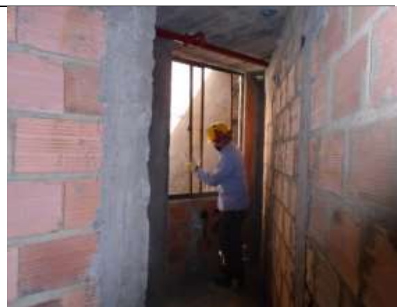
Fotografía 8. Desmonte de ventanería