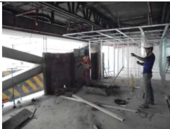
Fotografía 49. Amarre de hierro vigas cintas piso 5