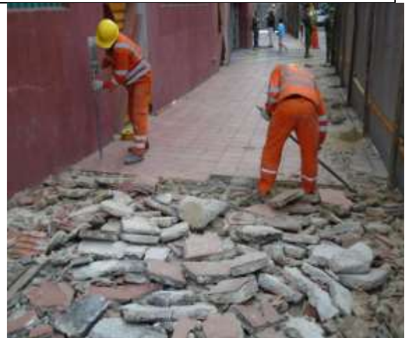
Fotografía 6. Demolición y retiro de acabado de piso en exterior