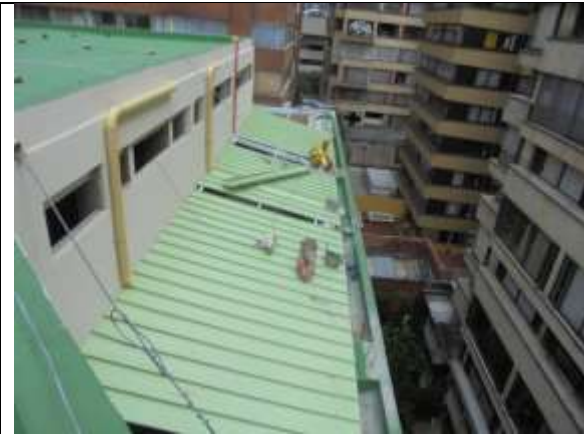
Fotografía 61. Instalación de teja en cubierta