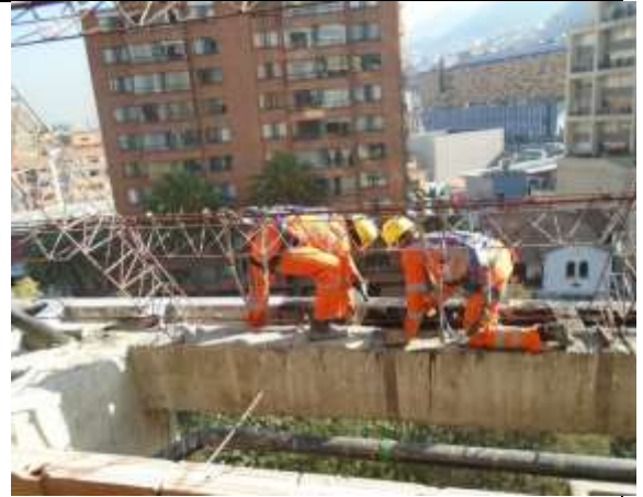
Fotografía 14. Retiro de manto en viga canal, cubierta