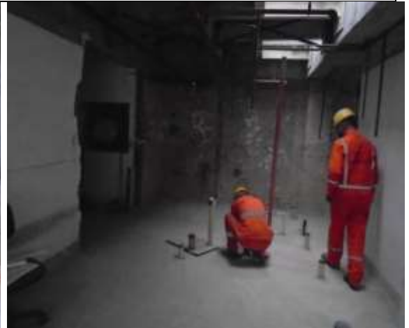
Fotografía 11. Replanteo mampostería en piso 2