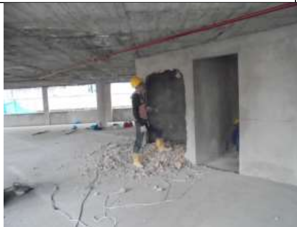
Fotografía 47. Demolición mampostería piso 8