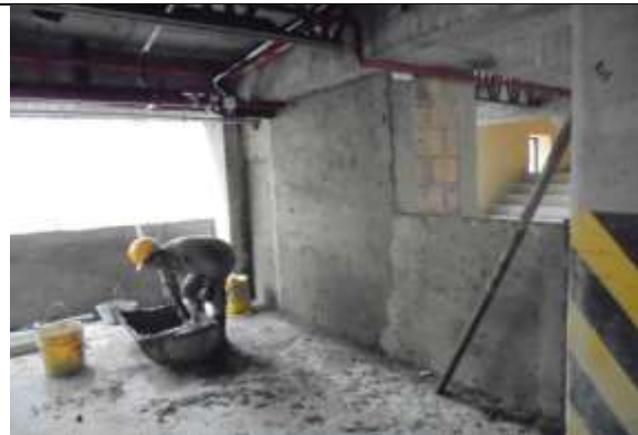
Fotografía 35. Pañete sobre muros, sótano, piso 5 y 8