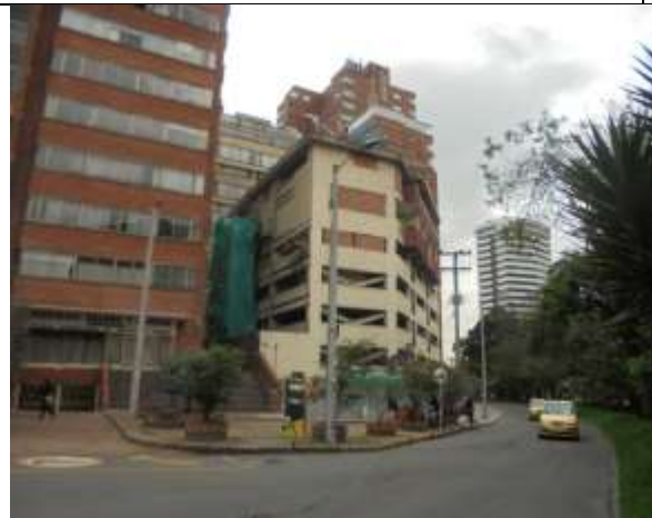
Fotografía 81. Fachada Oriental Edificio Diamante