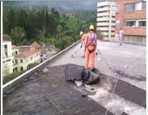
Fotografía 4. Retiro de manto asfáltico en cubierta