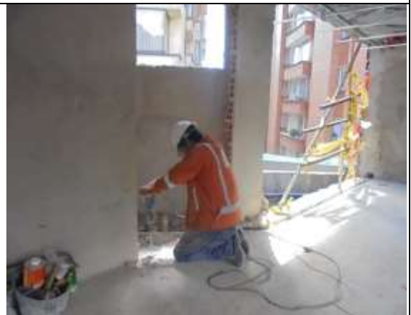
Fotografía 54. Anclajes epóxicos piso 8