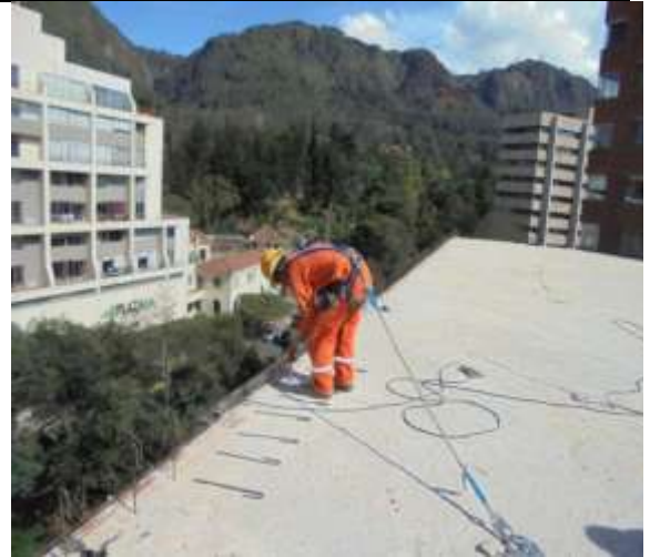
Fotografía 26. Anclajes epóxicos cubierta