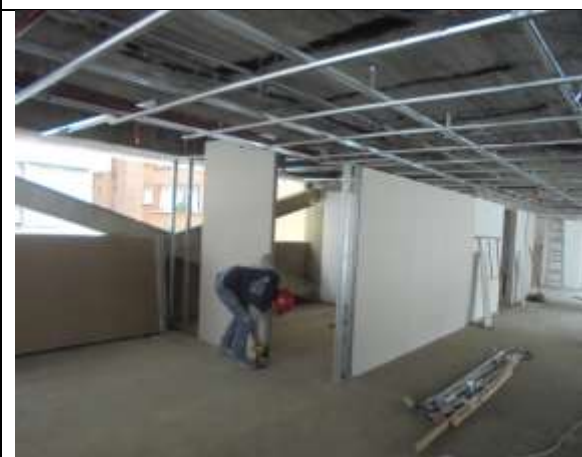
Fotografía 77. Instalación de Laminas de drywall