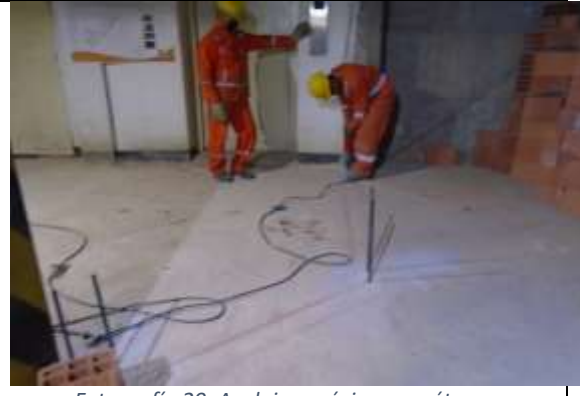
Fotografía 20. Anclajes epóxicos en sótano