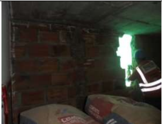
Fotografía 120. Demolición mampostería piso 8 (vanos para ventanas)