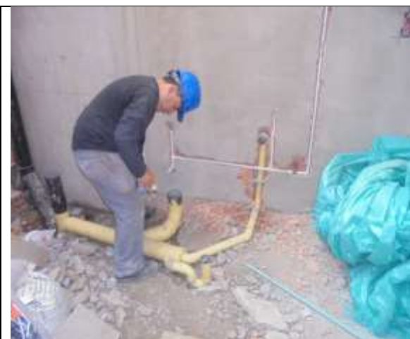
Fotografía 73. Instalaciones hidrosanitarias piso 7