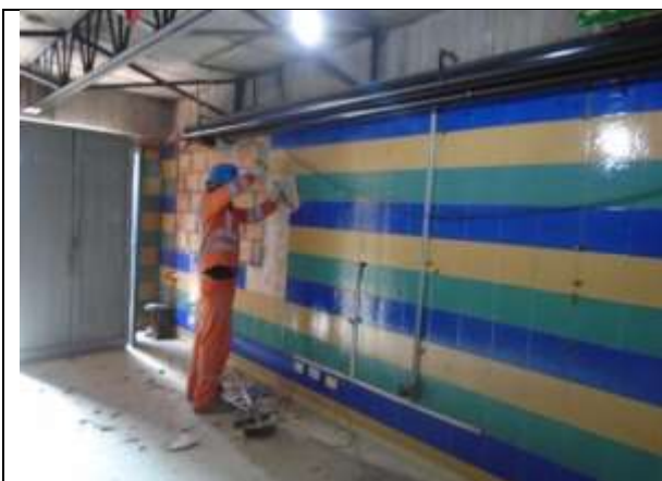
Fotografía 7. Demolición acabado de muros