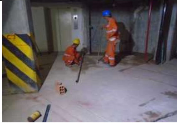
Fotografía 109. Replanteo en sótano