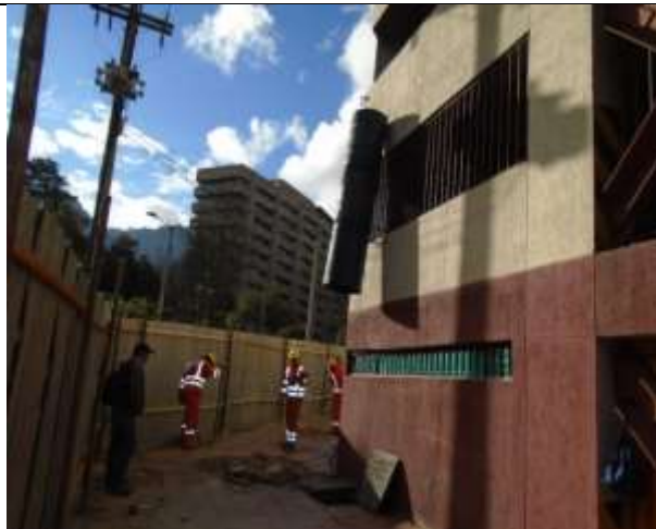
Fotografía 5. Construcción de cerramiento de obra