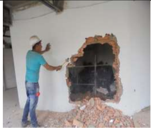
Fotografía 46. Demolición mampostería piso 5