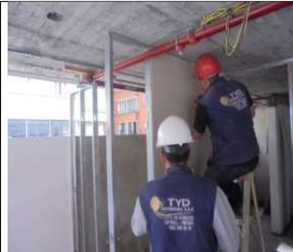
Fotografía 67. Instalaciones muros en Drywall