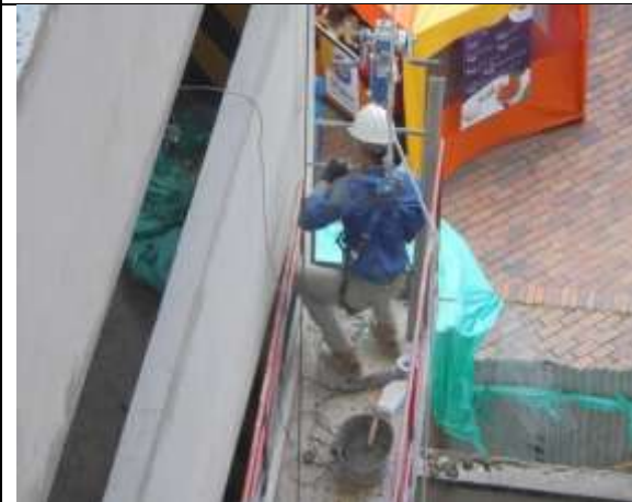
Fotografía 71. Dilataciones en Fachada