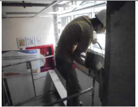
Fotografía 58. Vaciado de vigas cintas Punto Fijo