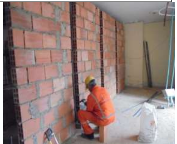
Fotografía 30. Mampostería en piso 6