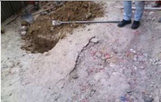
Fotografía 15. Inspección en zonas afectadas por paso de volquetas. No se encontró tubería, sin embargo, se hará un monitoreo continuo.