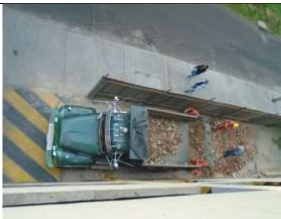
Fotografía 10. Cargue manual y retiro de escombros