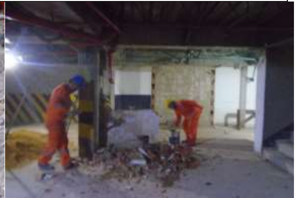
Fotografía 16. Demolición de mampostería en sótano