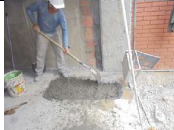
Fotografía 43. Fundida de placa en vacío piso 1, acceso peatonal