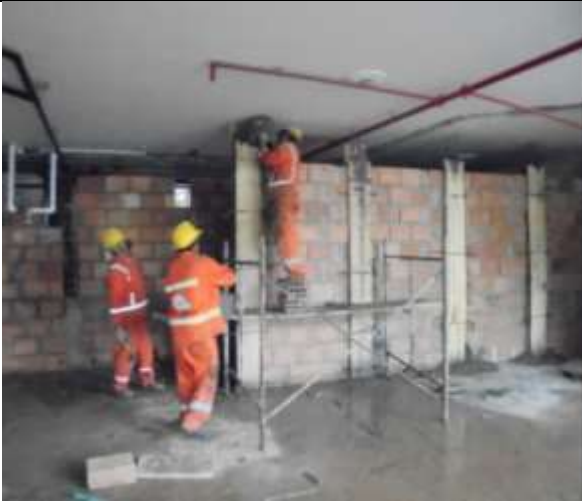
Fotografía 25. Vaciado de columnetas en piso 6