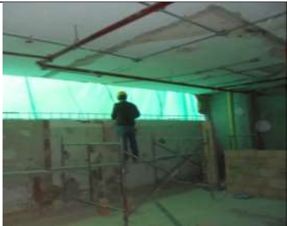
Fotografía 42. Colocación y amarre de acero de refuerzo