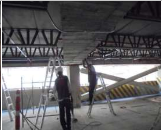
Fotografía 38. Instalación de tubería para salidas luminarias piso 5