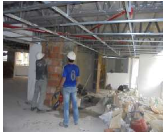
Fotografía 55. Vaciado de columnetas piso 5