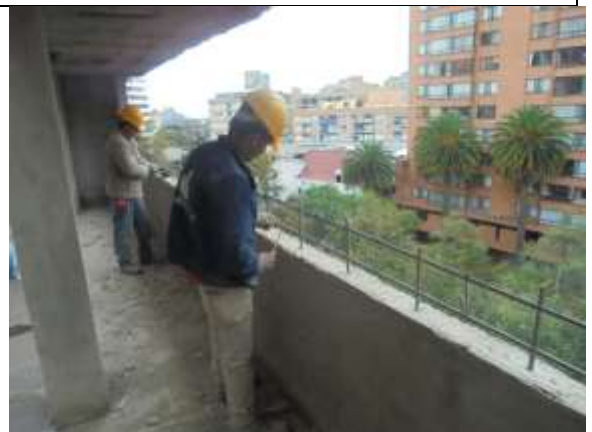
Fotografía 50. Amarre hierro vigas cintas piso 7