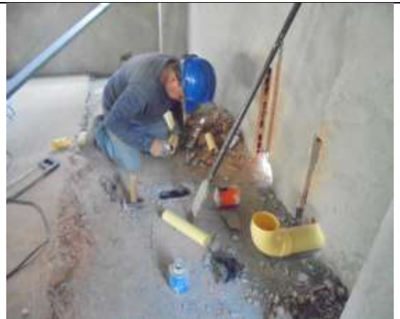
Fotografía 72. Instalaciones hidrosanitarias piso 8