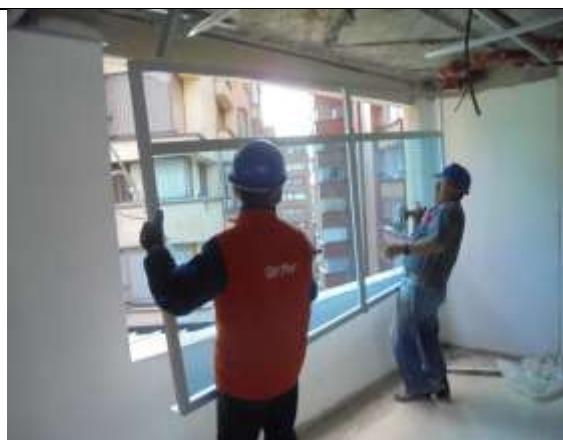
Fotografía 76. Instalación de ventanas