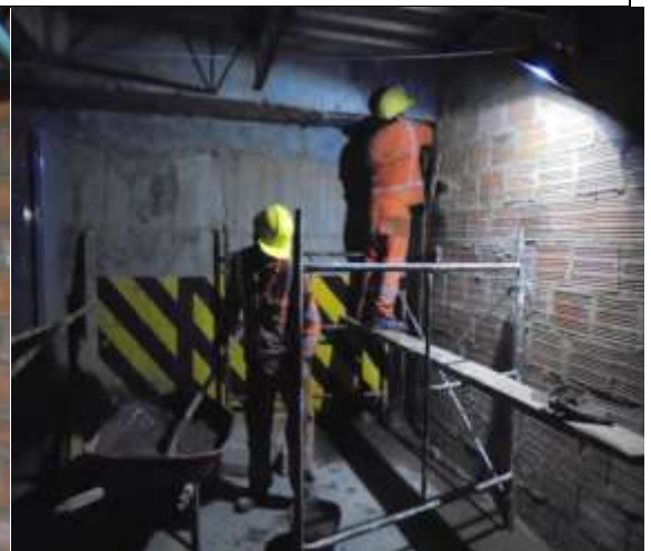
Fotografía 24. Vaciado de columnetas en sótano