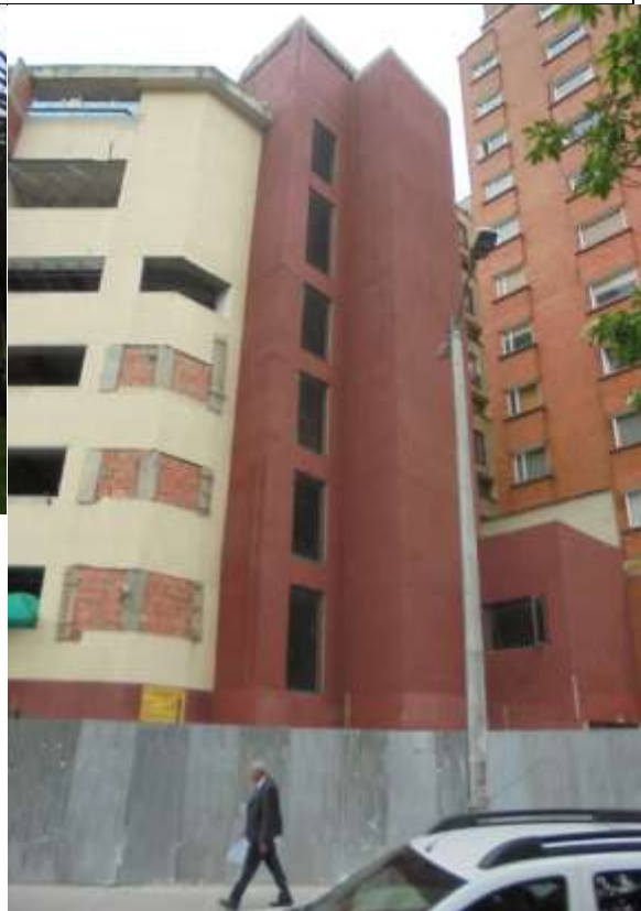
Fotografía 142. Fachada Principal Edificio Diamante