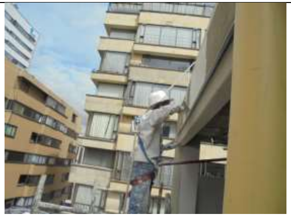
Fotografía 70. Aplicación de graniplas en la fachada