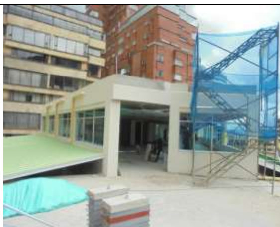
Fotografía 78. Fachada octavo piso