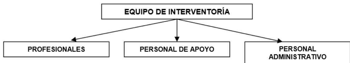
Grafica 1 .Equipo de Interventoría

Es por ello que de acuerdo a la magnitud y complejidad de la obra o del proyecto, se podrán requerir tres clases de personas para la conformación del equipo de trabajo de la Interventoría, y pueden ser según nos menciona el Arquitecto Heriberto Vidal Vanesa en su libro “Interventoría de Edificaciones. Para Arquitectos, Ingenieros, Constructores y Tecnólogos” y que a su vez se subdivide o se agrupan en categorías, de acuerdo al nivel en que se encuentre cada uno y en donde destaca también lo importante y preferible que es tener un número reducido de personal profesional y de contar con un buen grupo auxiliar que sirva de apoyo a la labor de la Interventoría. Esta clasificación o conformación es: