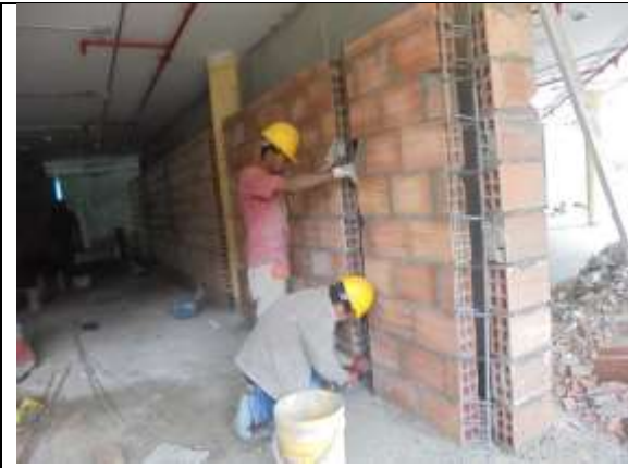
Fotografía 51. Amarre de hierro columnetas piso 6