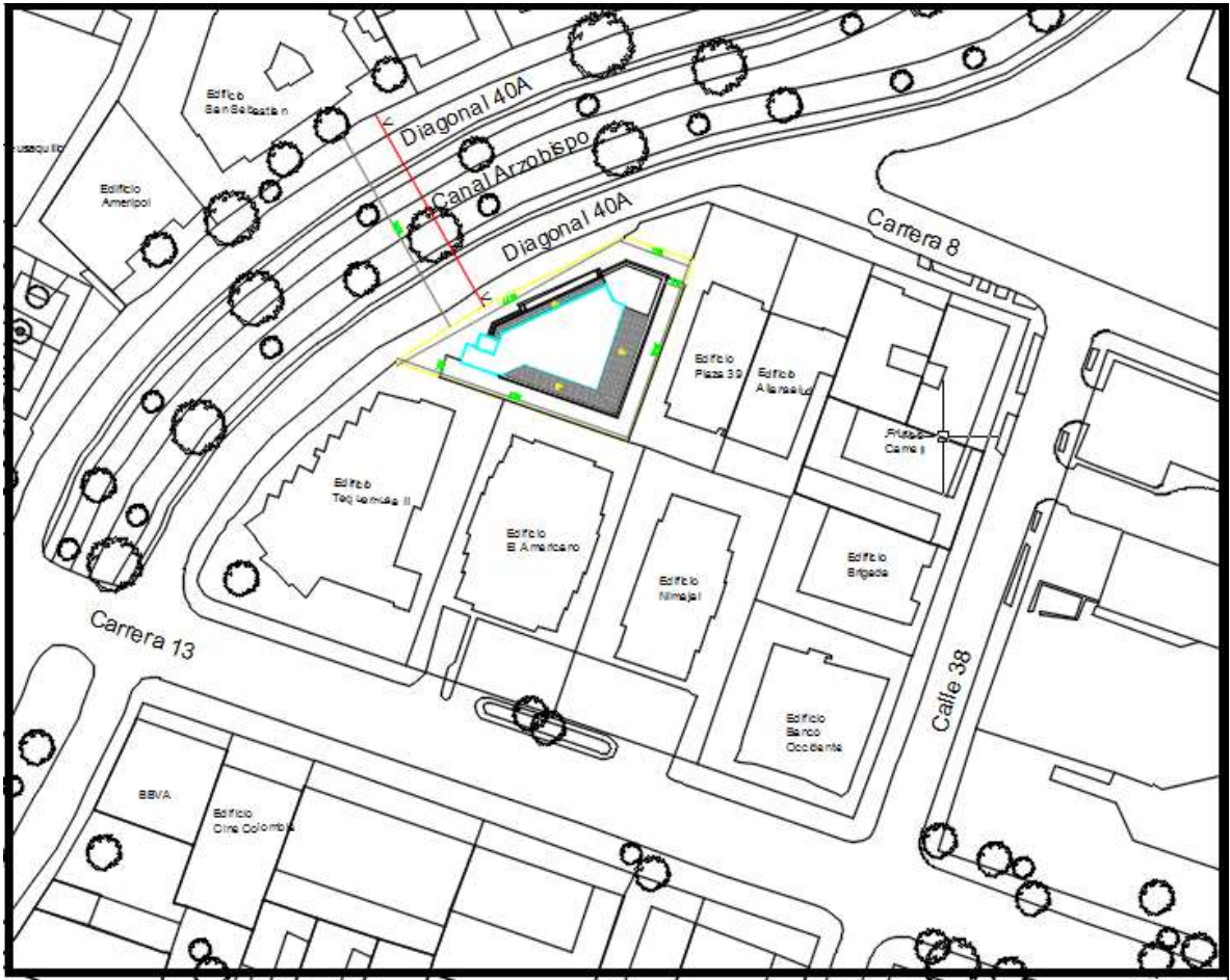
Grafica 3. Localización Edificio Diamante.