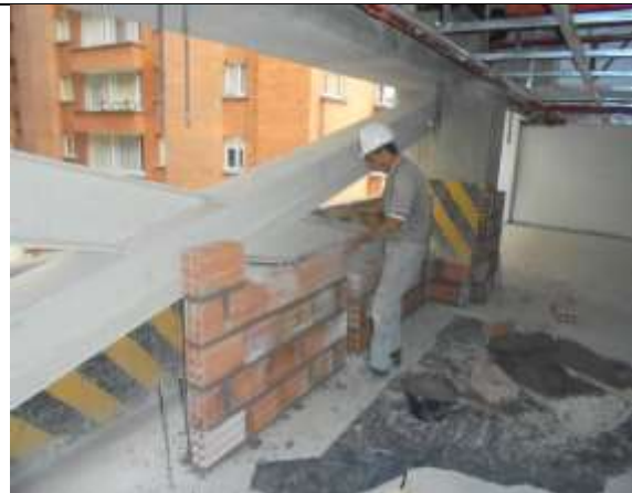
Fotografía 59. Mampostería piso 5