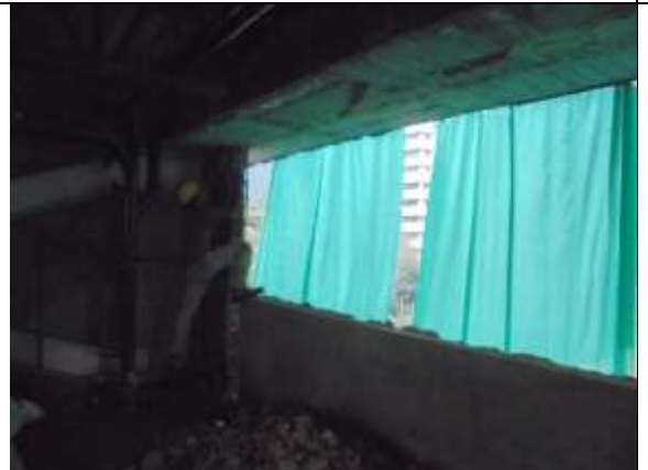
Fotografía 39. Demolición mampostería piso 7 (vanos para ventanas)