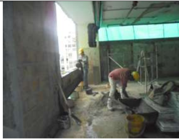
Fotografía 57. Vaciado de vigas cintas piso 6