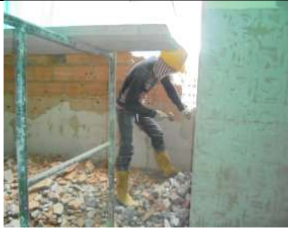
Fotografía 45. Demolición mampostería piso 6