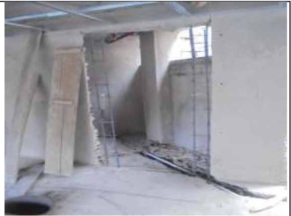
Fotografía 52. Amarre de hierro columnetas piso 8