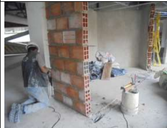
Fotografía 53. Anclajes epóxicos piso 5