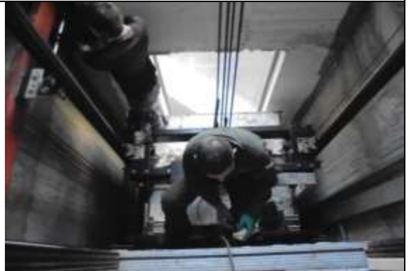
Fotografía 34. Mantenimiento, limpieza, revisión y pruebas en ascensor