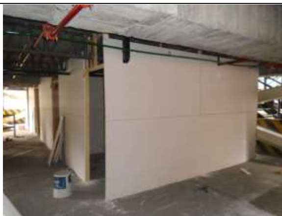
Fotografía 9. Construcción de campamento