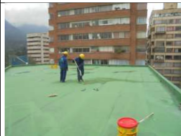
Fotografía 75. Pintura Epoxica sobre el manto Asfaltico