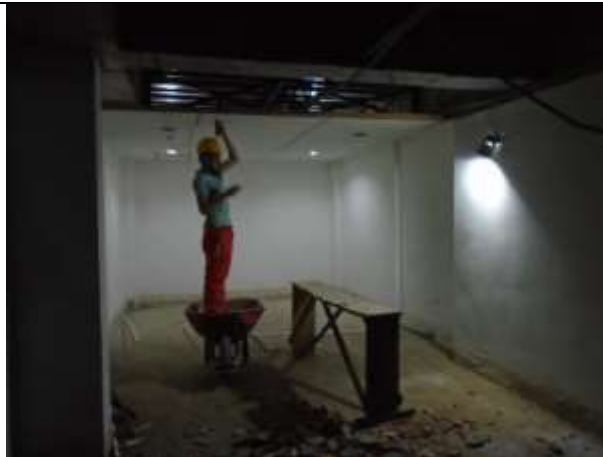
Fotografía 3. Desmonte de cielo raso