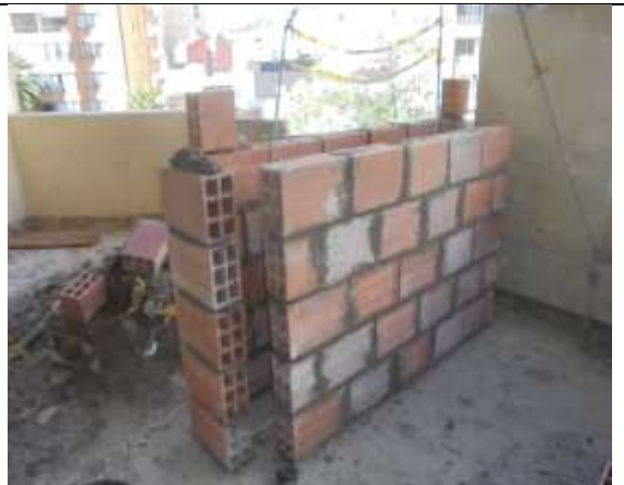
Fotografía 60. Mampostería piso 6