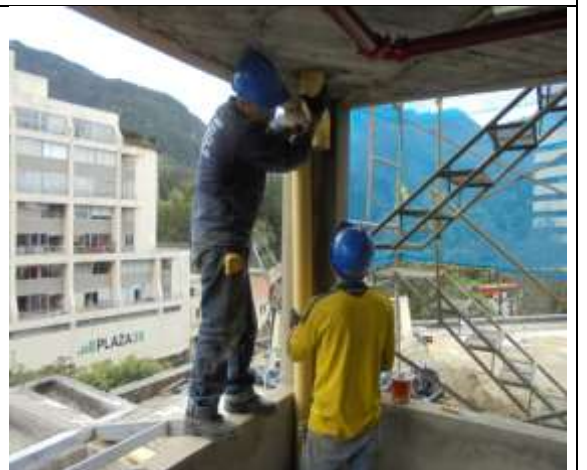
Fotografía 66. Bajantes en cubierta