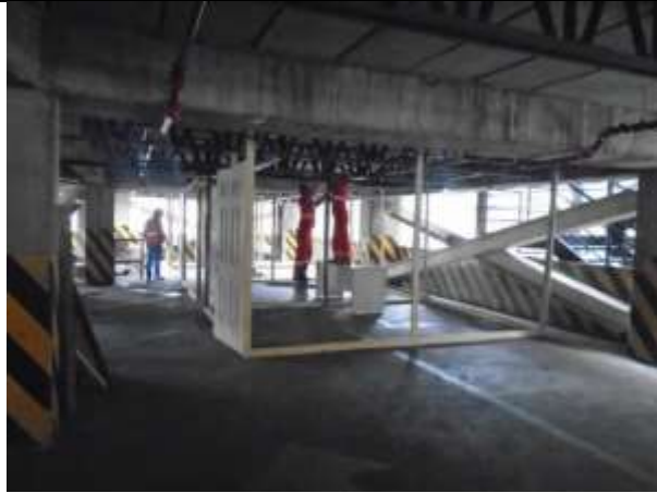
Fotografía 1. Construcción de campamento. Piso 4.