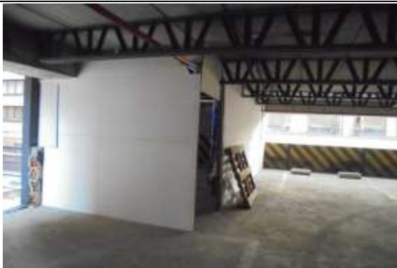
Fotografía 33. Construcción de campamento para el almacén piso 4