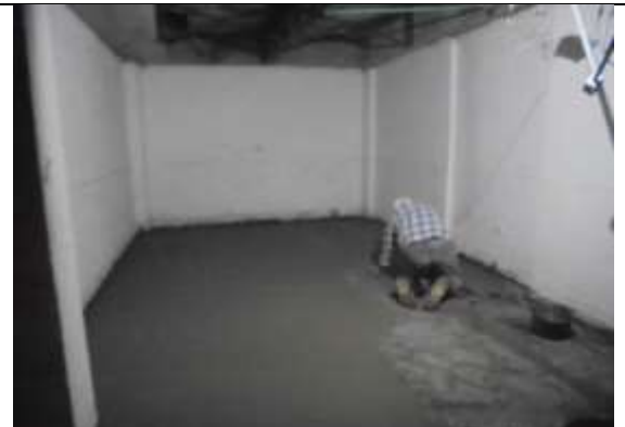
Fotografía 36. Afinado de piso en sótano