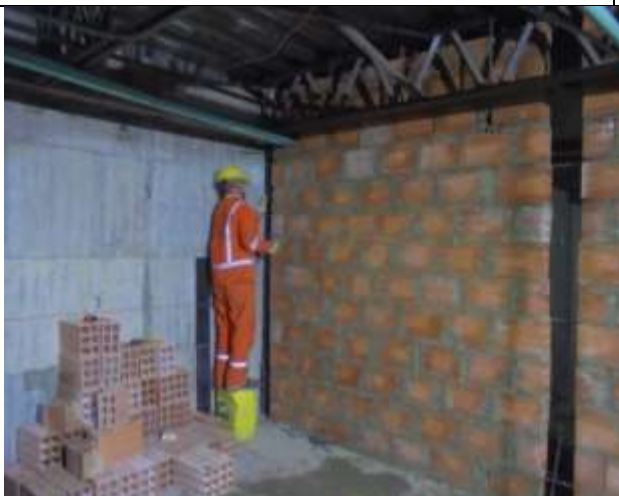
Fotografía 23. Colocación y amarre de refuerzo para columnetas en sótano