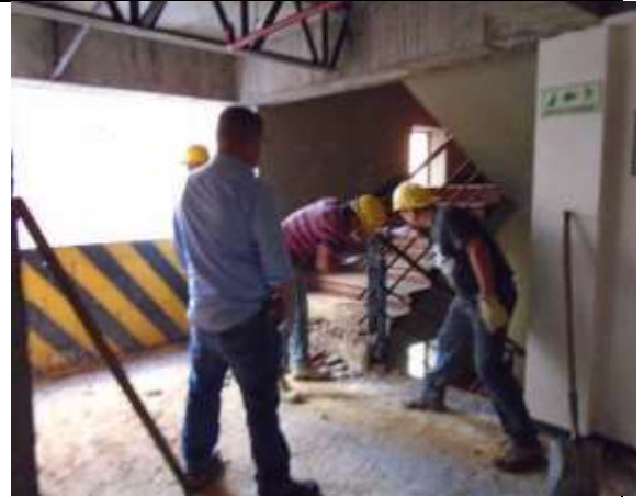
Fotografía 2. Desmonte de barandas, punto fijo