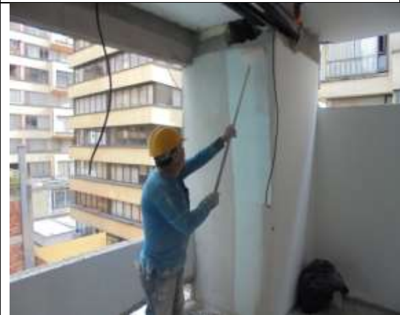
Fotografía 63. Pintura sobre muros