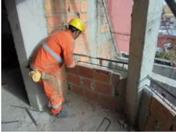
Fotografía 31. Construcción de vigas cintas en piso 8