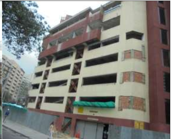
Fotografía 13. Fachada Edificio Diamante