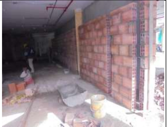
Fotografía 44. Mampostería en piso 6