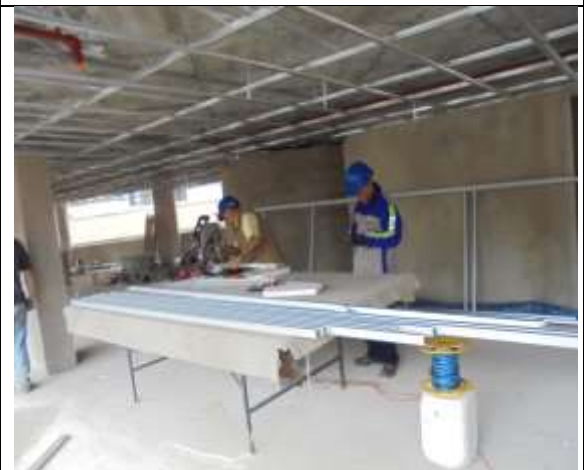
Fotografía 65. Carpintería metálica piso 8