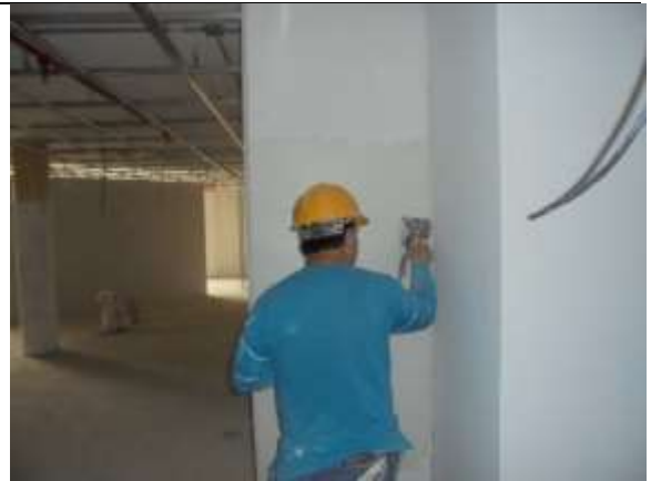
Fotografía 62. Estuco sobre muros