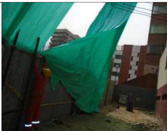
Fotografía 12. Instalación de polisombra