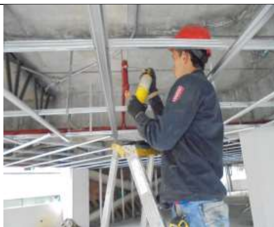
Fotografía 74. Nivelación de salidas para rociadores