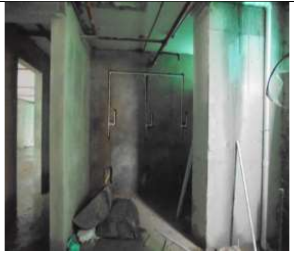
Fotografía 68. Instalaciones hidrosanitarias piso 6