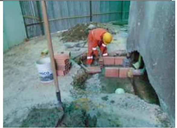
Fotografía 98. Reparación de caja de desagües