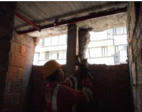
Fotografía 29. Demolición de mampostería en piso 8, 6, 2 y 1