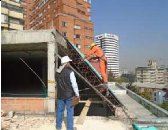
Fotografía 13. Retiro de cubierta