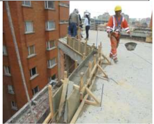
Fotografía 28. Construcción de bordillo en cubierta