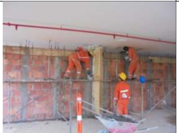
Fotografía 41. Vaciado de vigas cintas