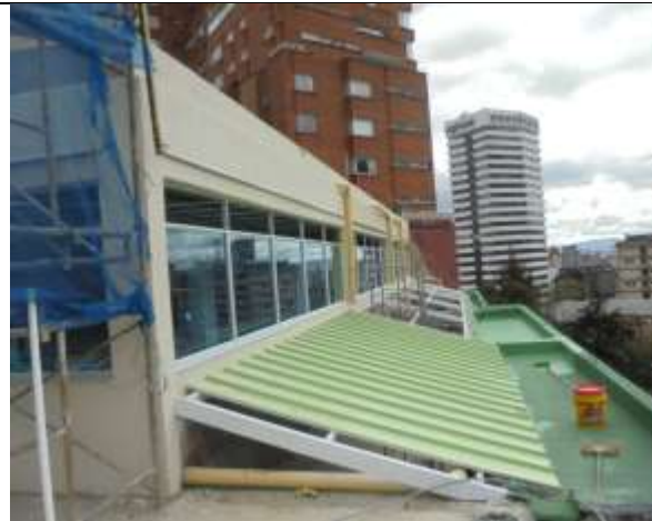
Fotografía 79. Fachada octavo piso