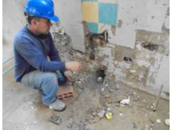
Fotografía 32. Suspensión puntos sanitarios en piso 8