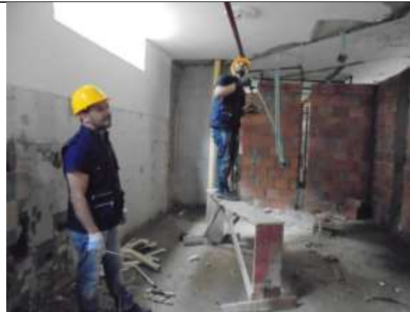
Fotografía 37. Desmonte de instalaciones eléctricas piso 6