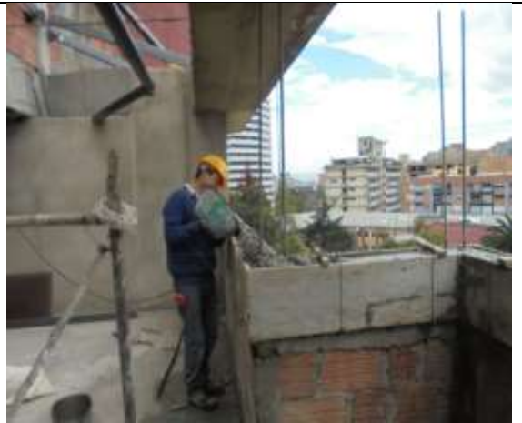
Fotografía 56. Vaciado de Viga Cinta piso 7