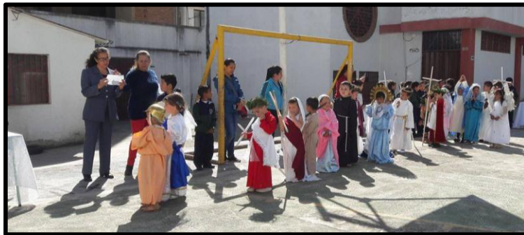
Imagen 15: Semana Santa