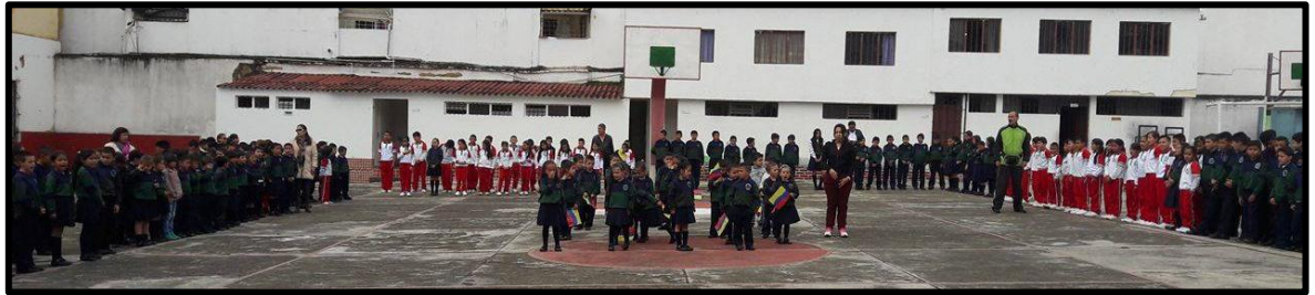
Imagen 14: Izada de Bandera