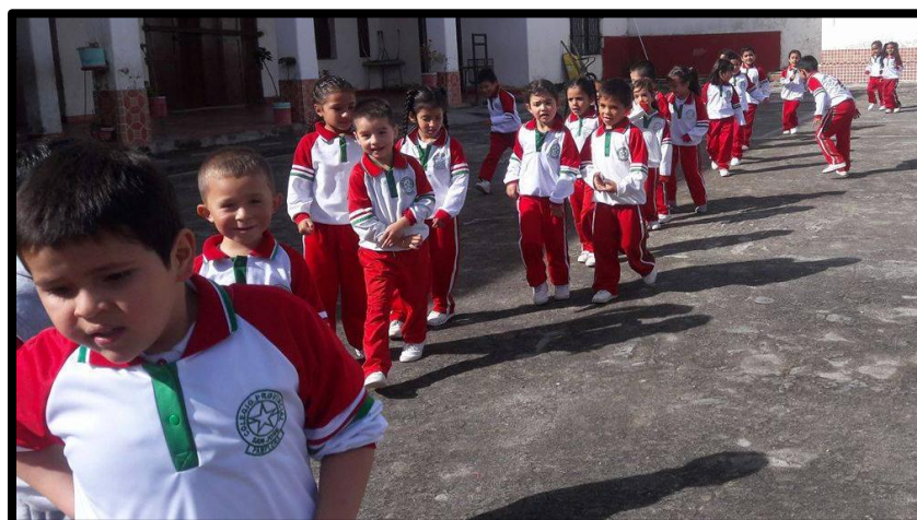
Imagen 12: Actividades de desarrollo del esquema corporal (correr y trotar)