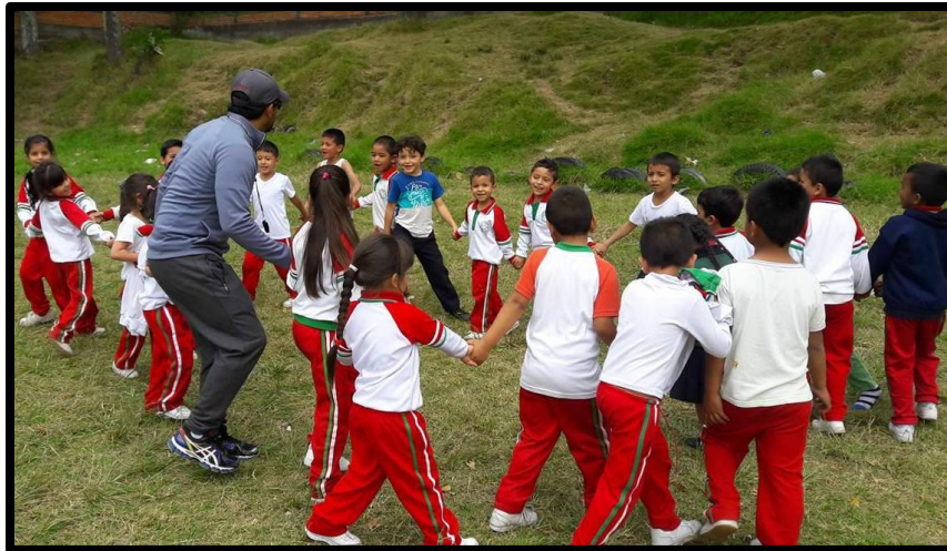
Imagen 13: Juegos de cooperación grupal (Rondas)