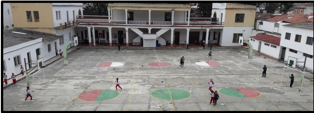
Imagen 1: Distribución de los salones segundo, tercero y cuarto

Encontramos a su vez en el primer piso un salón de transición, uno de tercero y uno de quinto y en el segundo piso siete aulas para los cursos de primero a quinto. Además existe una sala de informática, un salón de enfermería que no es utilizado y la coordinación, en un estado regular, aparte encontramos también una mini cafetería que sirve a los estudiantes, empleados y docentes del colegio.