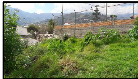
Imagen 4: Cancha de Fútbol y espacios a adecuar