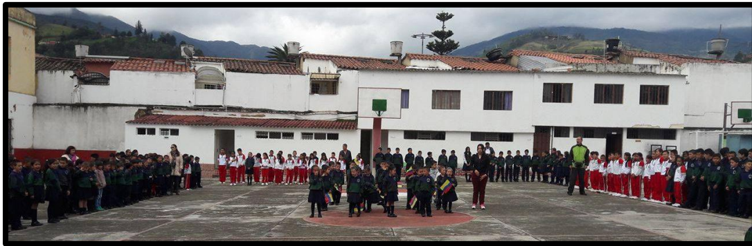
Imagen 2: Oficinas y baños del plantel