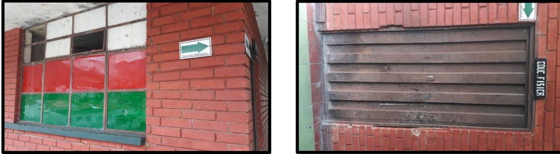
Imagen 6: Aula de educación física por fuera