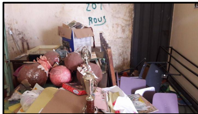
Imagen 5: Aula de educación física por dentro