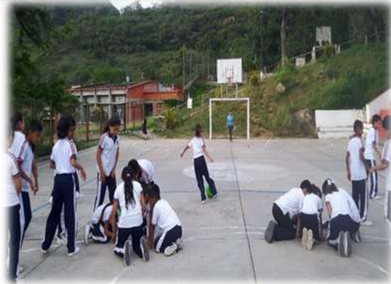
JUEGO COGNITIVO JUEGO DE COOPERACIÓN