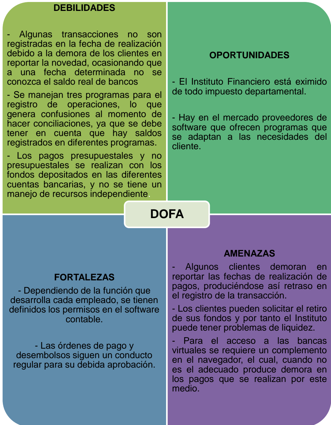
Figura 1. DOFA