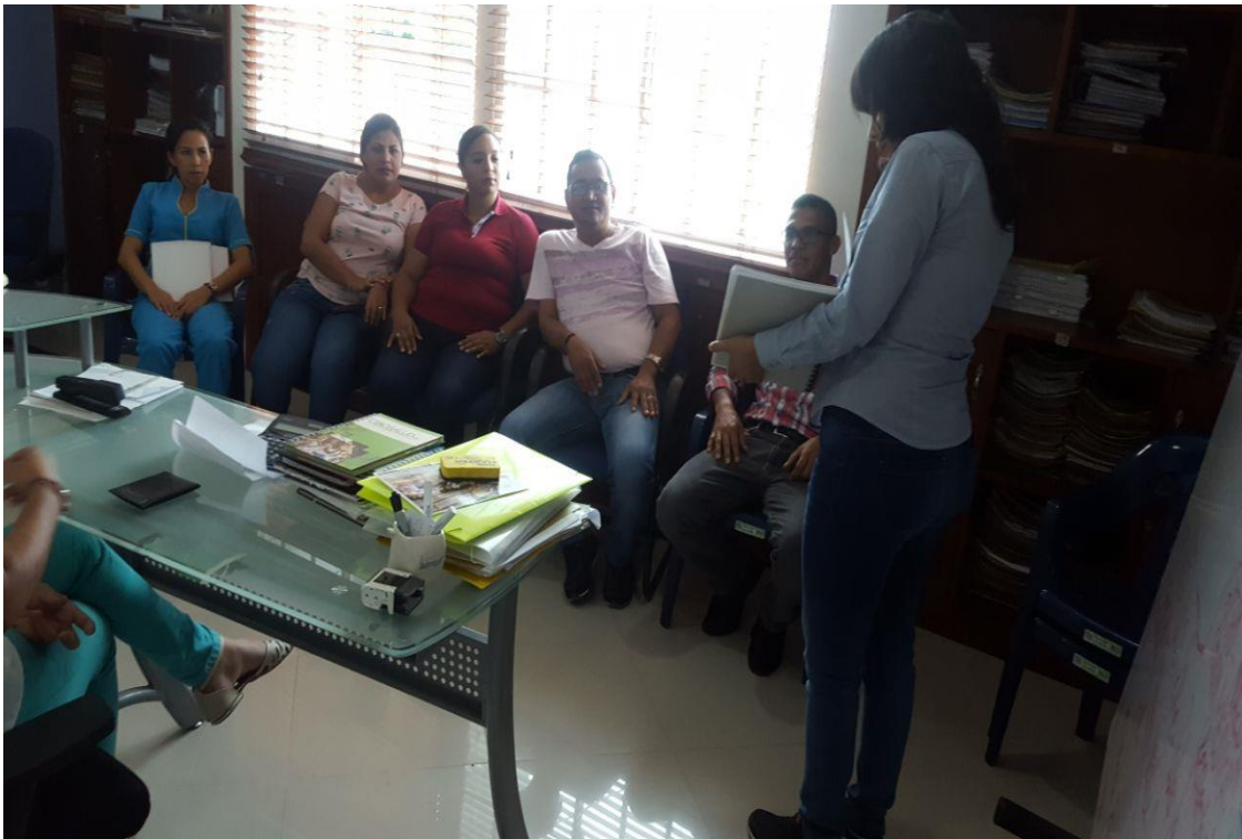
Anexos 7. Socialización del Manual de Políticas Contables