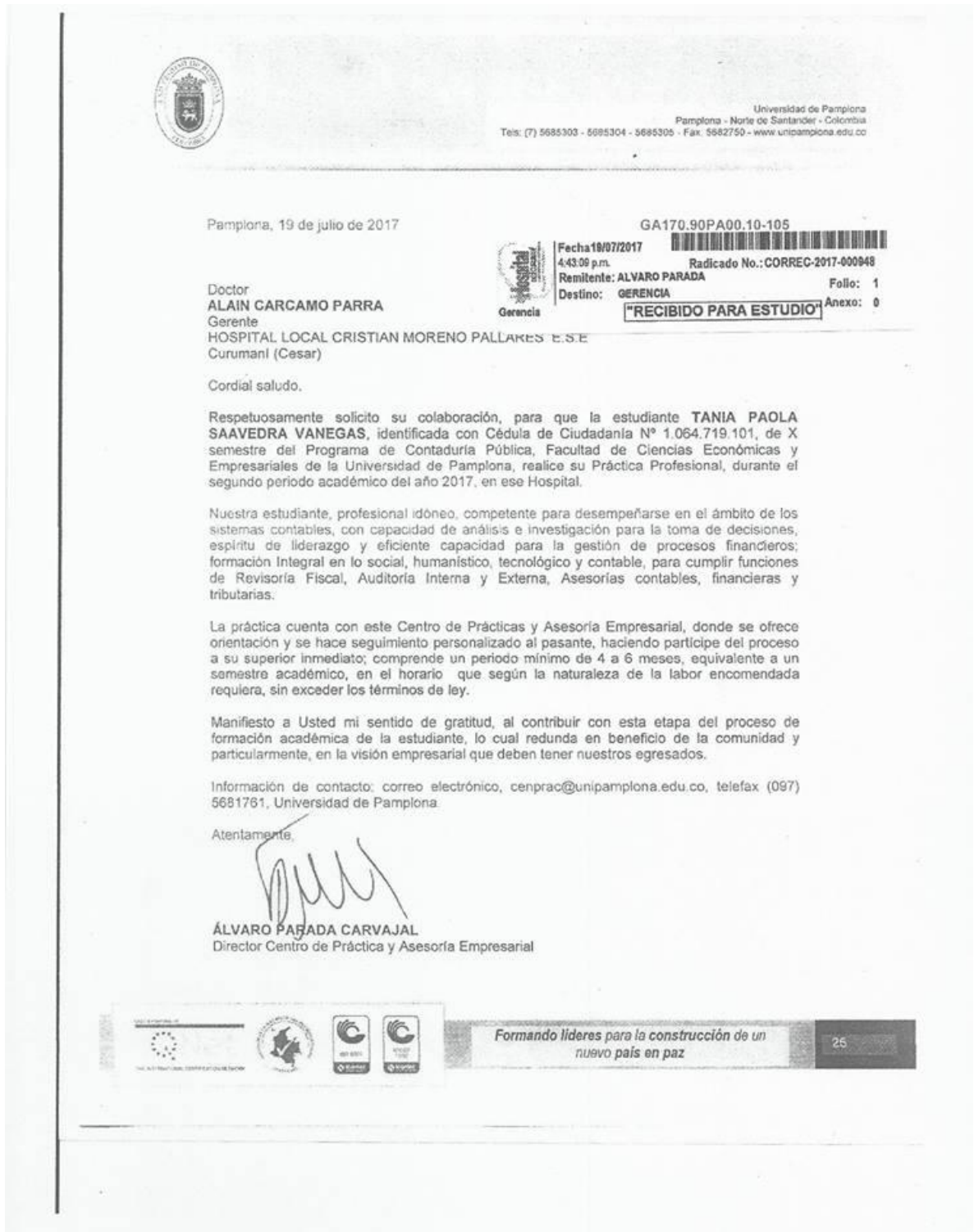
Anexos 1. Carta de presentación.